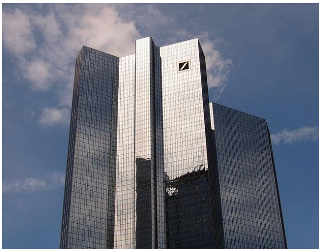
Slika 2. Deutsche bank, Frankfurt

Deutsche Bank osnovana je prije gotovo 150 godina kao partner njemačkim tvrtkama za njihove globalne bankarske potrebe. Danas je to vodeća europska banka sa svjetskim dosegom. Deutsche Bank pruža usluge komercijalnog i investicijskog bankarstva, bankarstvo s građanima, transakcijsko bankarstvo te proizvode i usluge upravljanja imovinom i bogatstvom. 10