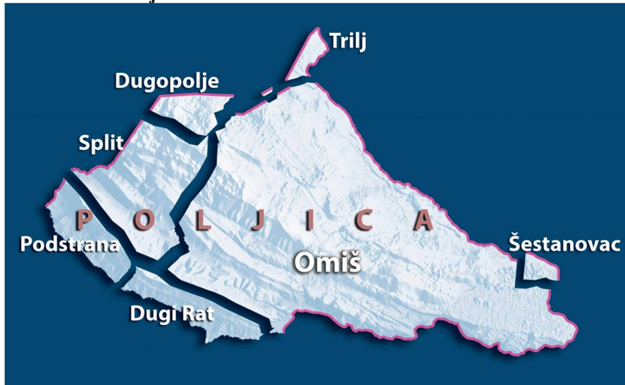
Slika 3: Karta Poljica