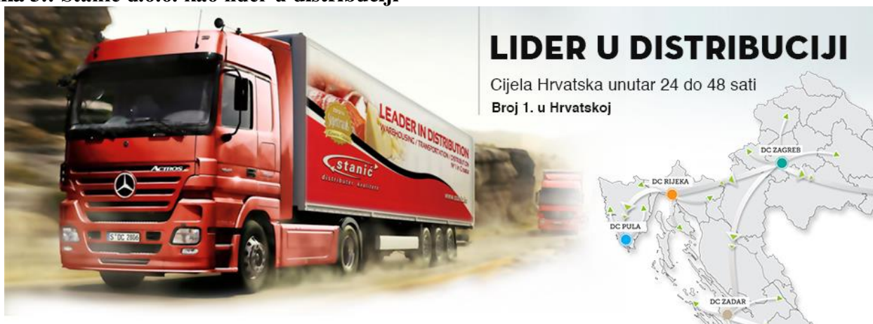
Slika 3.: Stanić d.o.o. kao lider u distribuciji

Dostavna vozila s rashladnim uređajima svakim danom distribuiraju proizvode na 900 lokacija. Iako po opsegu manji od prethodna tri navedena, zadarski distribucijski centar ima zadaću distribuirati vlastite proizvode na 400 lokacija. Veličina ovog skladišta je 500 m 2 u kojem se za nadzor najmodernijih komora, zaslužnih za čuvanje robe, brine 20 djelatnika. S istim brojkama raspolaže i dubrovačko skladište. Splitsko skladište, kao najveće od navedenih, proteže se na više od 2000 m 2 , raspolaže s preko 30 dostavnih vozila, koji dnevno distribuiraju proizvode na više od 700 lokacija. Trenutno je u navedenom skladištu zaposleno 27 djelatnika.