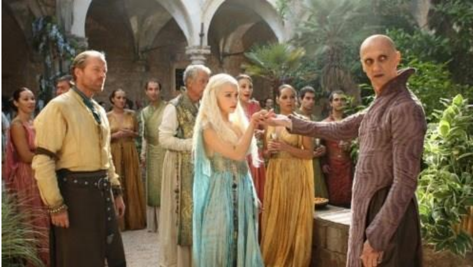
Slika 4: Otok Lokrum u seriji poznat kao Qarth

Šeststo metara od kopna nalazi se grad Qarth, inače poznat kao otok Lokrum. Ovo je mjesto gdje Daenerys Targaryen dobiva hladnu dobrodošlicu od Spice kralja.