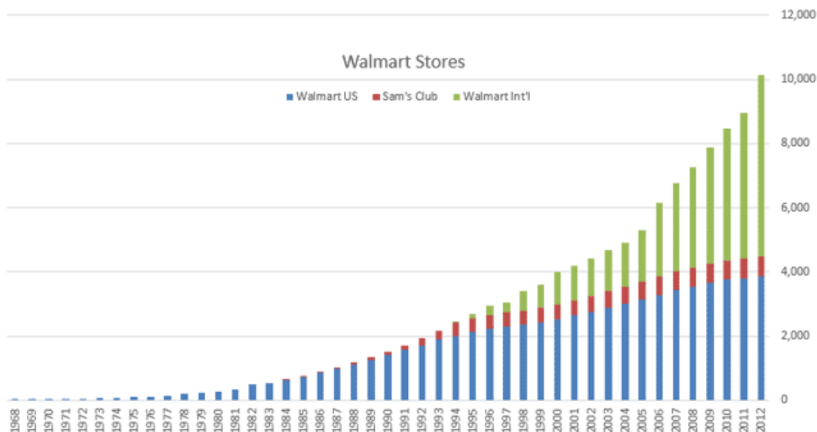
Slika 3: Porast broja Walmart trgovina u razdoblju od 1968. do 2012.