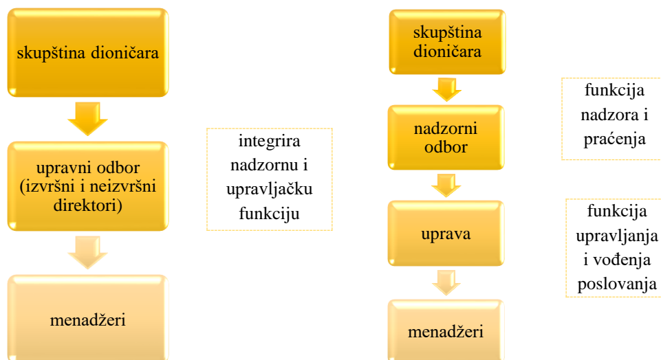
Slika 2: Jednorazinski i dvorazinski model korporativnog upravljanja

Razlika između jednorazinskog i dvorazinskog modela korporativnog upravljanja prikazana je na slici 2.