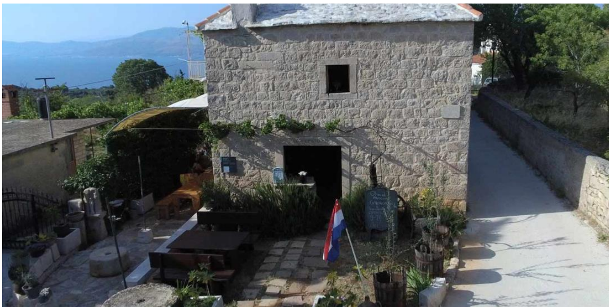
Slika 7: Muzej maslinovog ulja u mjestu Škrip na Braču