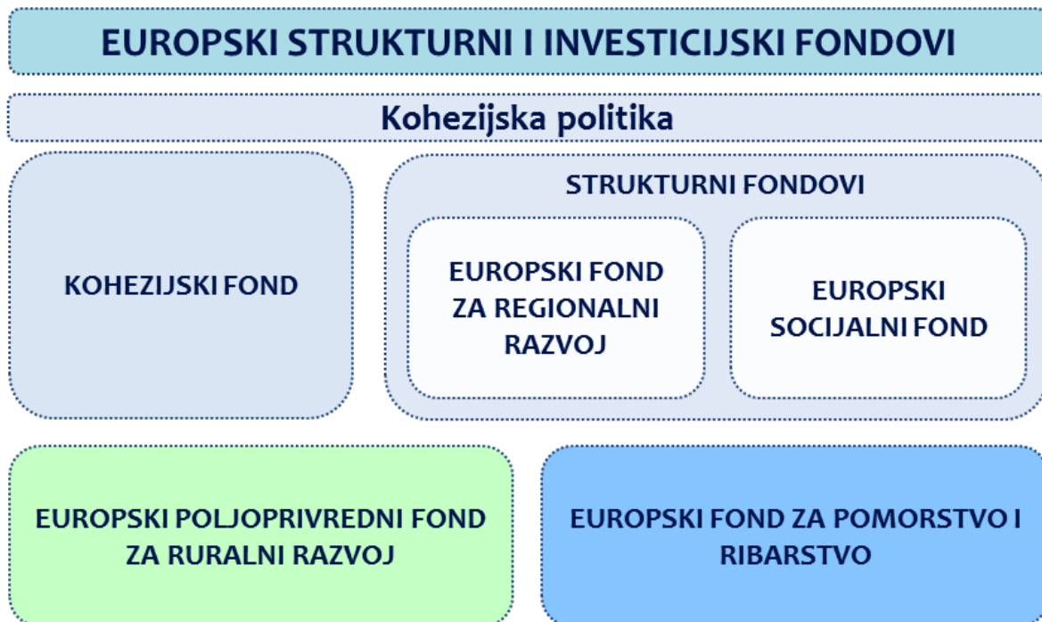
Slika 1: Podjela EU fondova

Svih pet fondova imaju zajednički naziv Europski strukturni i investicijski fondovi (ESI fondovi). 13