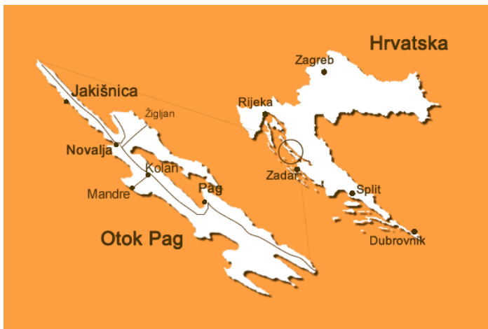
Slika 1: Zemljopisni položaj otoka Paga

Vrlo dobar zemljopisni položaj te vrhunska prometna povezanost pomaže da ispuni svoji svoj turistički potencijal. U usporedbi s drugim otocima na Jadranu, otok Pag sigurno spada u one otoke do kojih se najlakše može doći, što je veoma bitan faktor za mnoge strance koji odluče posjetiti ovaj dio Mediterana.