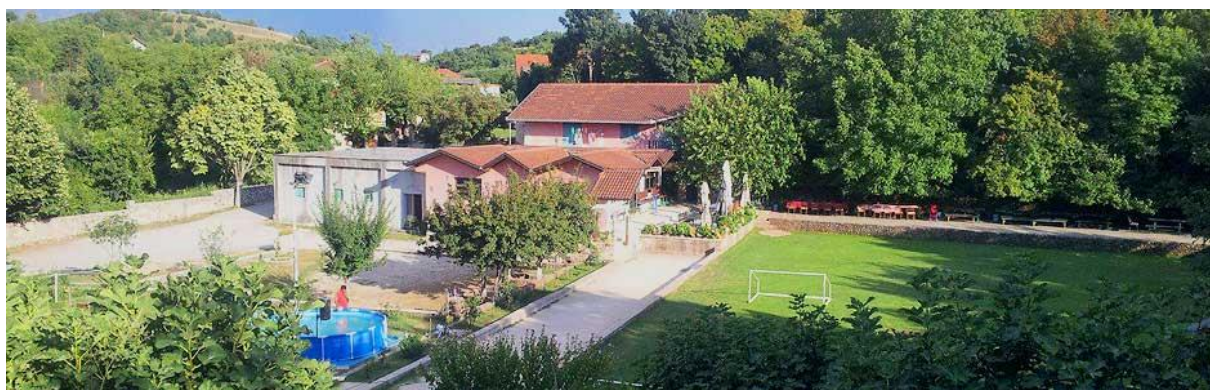
Slika 3.: Obiteljsko domaćinstvo Mustang, dostupno na: www.visitsinj.hr