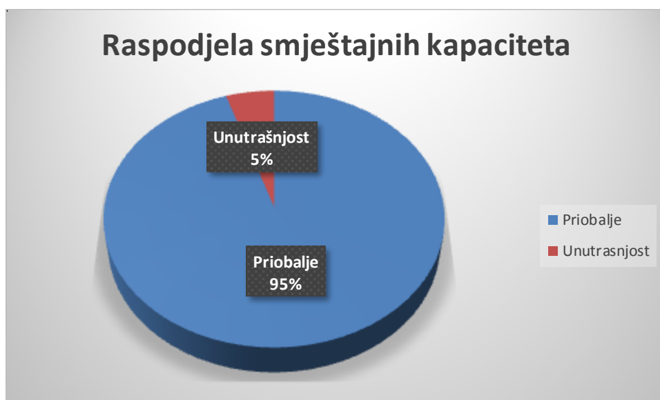
Grafikon 1. Raspodjela smještajnih kapaciteta u RH

Program ruralnog razvoja Republike Hrvatske 2014. - 2020. je odobren 26. svibnja 2015. godine i, prema njegovim klasifikacijama, čitava Hrvatska je ruralno područje, osim područja gradova Zagreba, Rijeke, Osijeka i Splita. Prema istraživanjima koja su provedena u svrhu sastavljanja navedenog programa, ruralni turizam u Hrvatskoj je nerazvijen, ponajviše zahvaljujući orijentaciji na primorski turizam te nedovoljnoj afirmaciji domaće gastronomije i vinarstva. Pogledajmo kako izgleda raspodjela turističkih ležajeva u Hrvatskoj. ( Program ruralnog razvoja Republike Hrvatske 2014. - 2020. je odobren 26. svibnja 2015. godine i, prema njegovim klasifikacijama, čitava Hrvatska je ruralno područje, osim područja gradova Zagreba, Rijeke, Osijeka i Splita. Prema istraživanjima koja su provedena u svrhu sastavljanja navedenog programa, ruralni turizam u Hrvatskoj je nerazvijen, ponajviše zahvaljujući orijentaciji na primorski turizam te nedovoljnoj afirmaciji domaće gastronomije i vinarstva. Pregled turističkih ležajeva u Hrvatskoj: 18