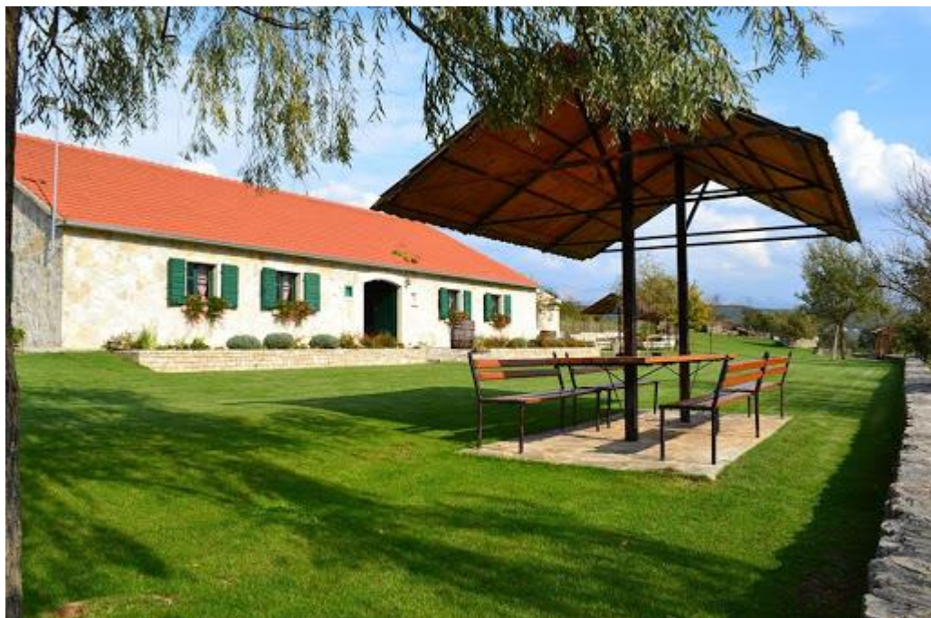
Slika 2. :Seosko gospodarstvo Panj, dostupno na: www.visitsinj.hr

Panj nudi uslugu proslave vjenčanja na otvorenome. Vjenčanja na otvorenome su postala veliki trend, što stavlja ovo domaćinstvo na visokoj poziciji u Cetinskoj krajini.