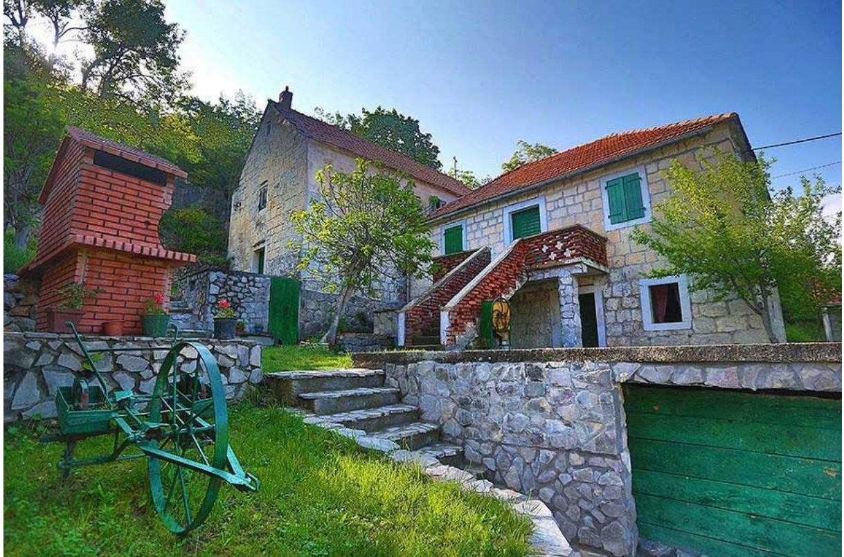
Slika 1. Seosko domaćinstvo Podastrana, dostupno na: http://adventurezagora.com/

domaćoj spizi i adrenalinskom parku. Sljedeći dan se održavala proslava rođendana, te prateće aktivnosti, nadalje jutarnji paintball uz gradelavanje. Iz dana u dan, sve do danas je izletišta bilo bukirano, od proslava pričesti, rođendana, momačkih i djevojačkih večeri, adrenalinskih i sportskih aktivnosti.