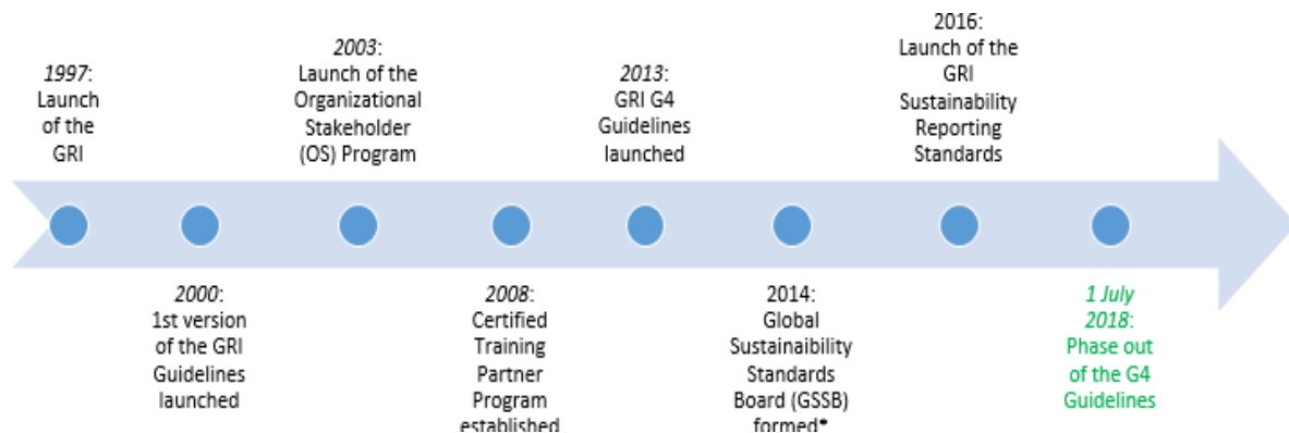
Slika 4: Razvoj GRI standard