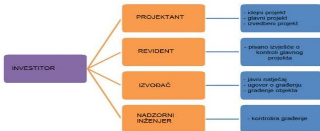
Slika 3 : Sudionici u izgradnji objekta