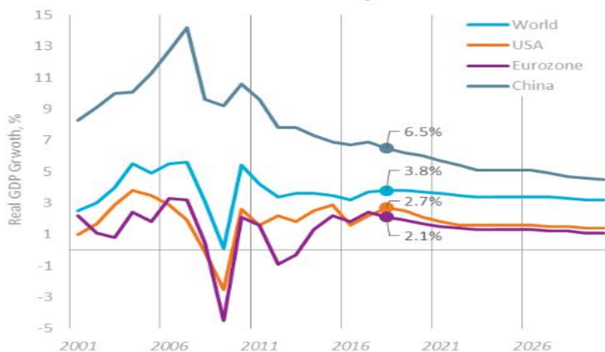
Real GDP Growth in the World's Major Economies: 2001-2030

Source: Euromonitor International's Macro Model Note: Data labels show forecast values for 2018.