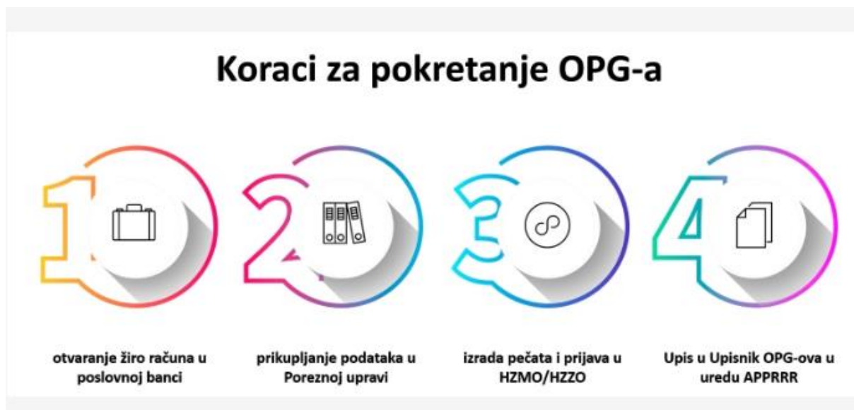
Slika 3: koraci za pokretanje OPG – a