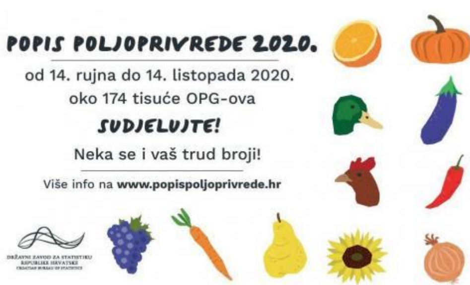
Slika 7: Poziv za popis poljoprivrede 2020.

Prikupljeni podaci o strukturi poljoprivrednih gospodarstava bit će usporedivi na razini Europske unije i pružit će potrebnu statističku bazu za planiranje, provedbu, nadzor, procjenu i reviziju povezanih politika, osobito Zajedničke poljoprivredne politike (ZPP-a), uključujući mjere ruralnog razvoja, okolišne politike, politike za prilagodbu klimatskim promjenama i njihovo ublažavanje, korištenja zemljišta i neke ciljeve održivog razvoja. 35