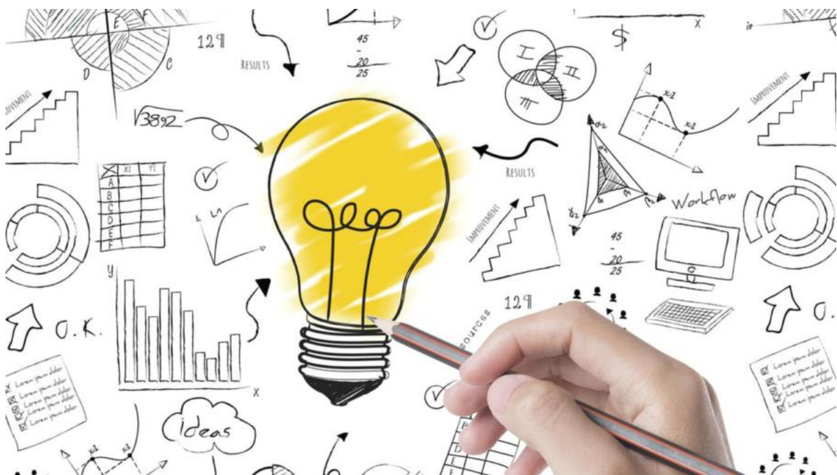
Slika 1: The Entrepreneurial Process