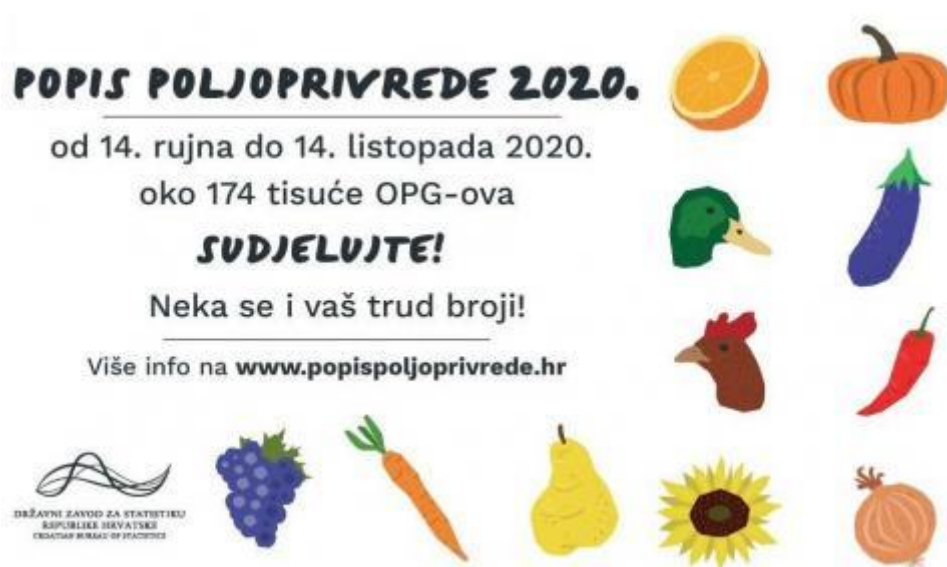
Slika 7: Poziv za popis poljoprivrede 2020.

Prikupljeni podaci o strukturi poljoprivrednih gospodarstava bit će usporedivi na razini Europske unije i pružit će potrebnu statističku bazu za planiranje, provedbu, nadzor, procjenu i reviziju povezanih politika, osobito Zajedničke poljoprivredne politike (ZPP-a), uključujući mjere ruralnog razvoja, okolišne politike, politike za prilagodbu klimatskim promjenama i njihovo ublažavanje, korištenja zemljišta i neke ciljeve održivog razvoja. 35