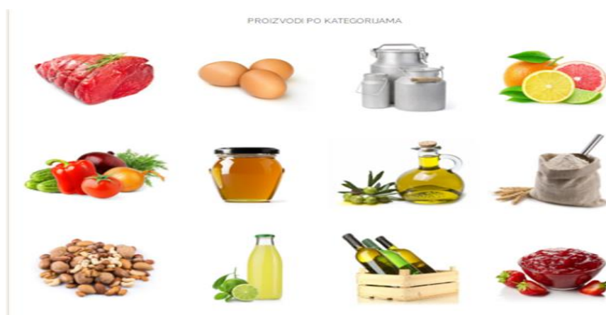
Slika 6: kategorije proizvoda dostupnih za kupnju