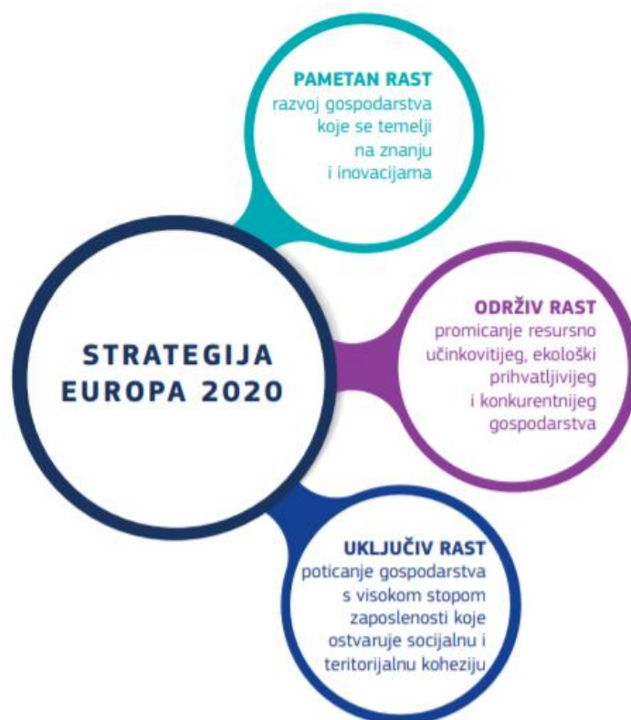
Slika 1: Tri socio-ekonomska cilja prema Strategiji Europa 2020.