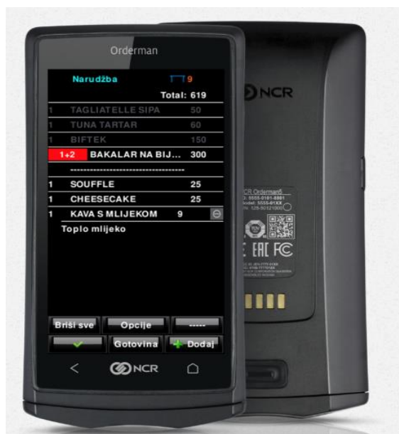
Slika 1: NCR Orderman 5