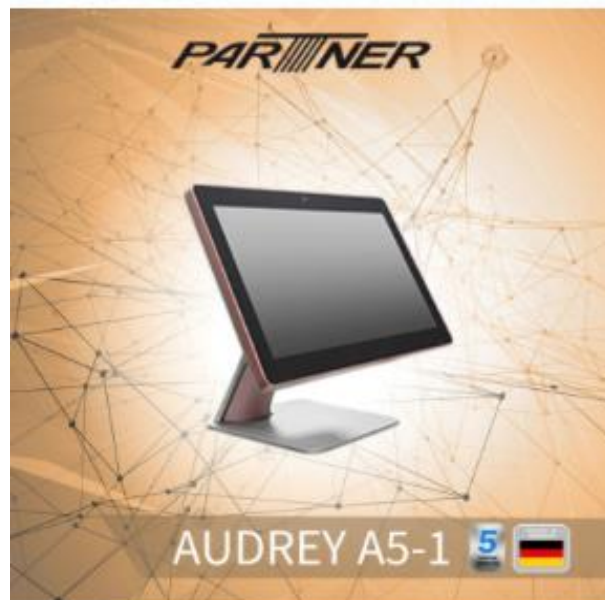
Slika 3: All in one POS sustav – PartnerTech Audrey