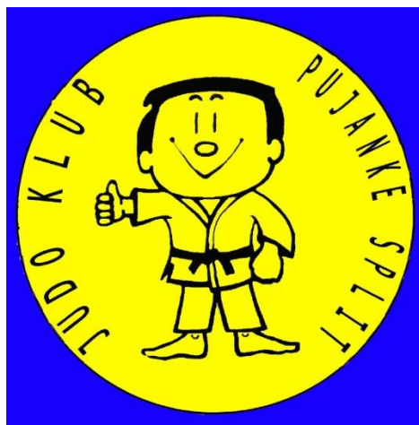
Slika 3. Grb Judo kluba Pujanke