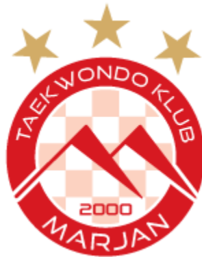
Slika 4. Grb taekwondo kluba Marjan

Taekwondo klub Marjan upisan je u Registar neprofitnih organizacija 10.08.2009.g. sa sjedištem na adresi Šimićeva 9E u Splitu. Prema pravnom obliku, ovaj klub djeluje kao udruga te je obveznik vođenja dvojnog knjigovodstva.