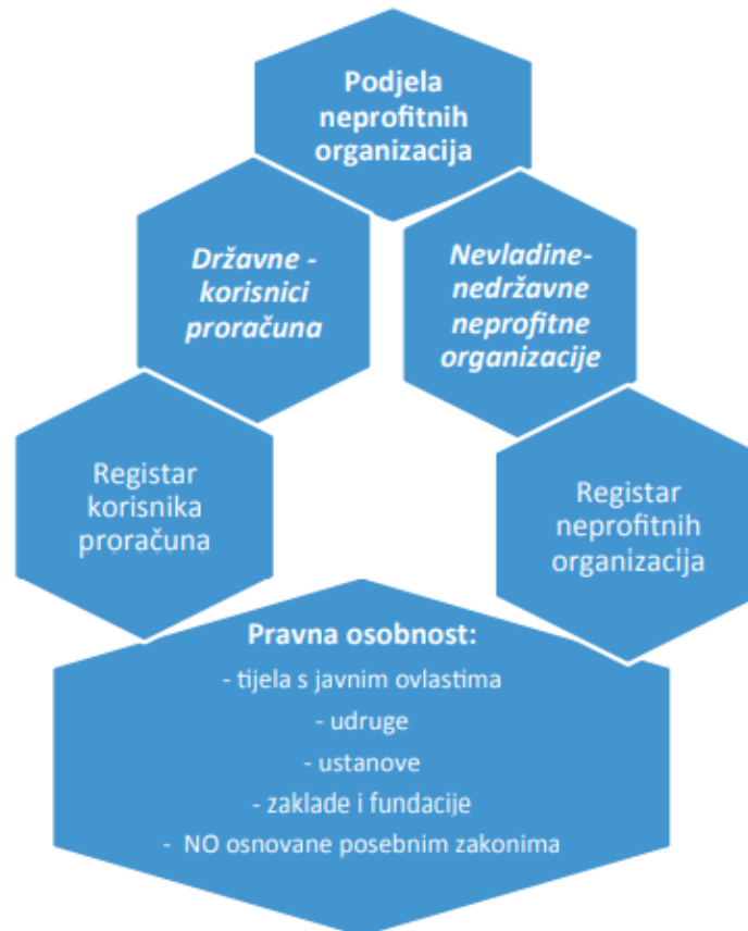
Slika 2. Podjela neprofitnih organizacija