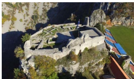
Slika 8: Tvrđava Topana

Tvrđava Topana se nalazi iznad Modrog jezera te je nastala u 10. stoljeću i jedna je od najznačajnijih fortifikacijskih objekata u unutrašnjem dijelu Dalmacije, a ime je dobila po kuli za topove koja je sagrađena za vrijeme Kandijskog rata 1663. godine. 34 Uz spomenutu tvrđavu nalazi se nogometni stadion jedinstvenog izgleda Gospin dolac koji je naziv dobio po crkvi Gospe od Anđela koja se nalazi u blizini stadiona. 35