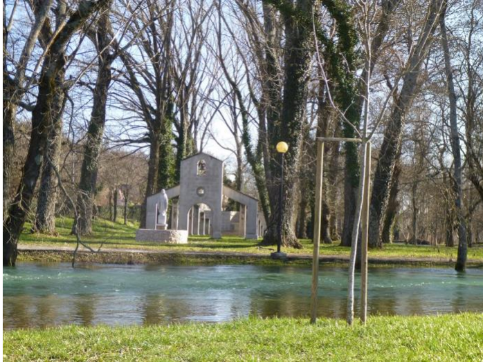
Slika 4: Rijeka Vrljika i Zelena katedrala