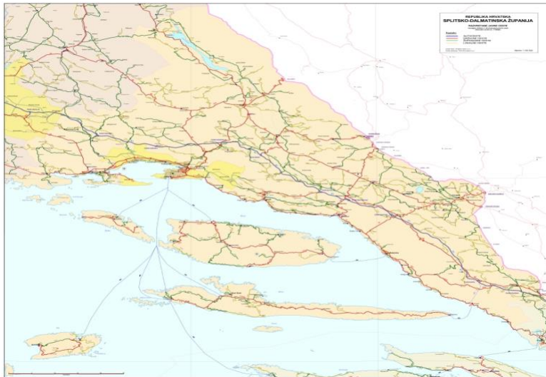
Slika 9: Karta cesta SDŽ

Imotska krajina ima dobru cestovnu povezanost što se može zaključiti na sljedećoj slici koja predstavlja kartu cesta Splitsko-dalmatinske županije na kojoj se vidi i cijela cestovna povezanost Imotske krajine.