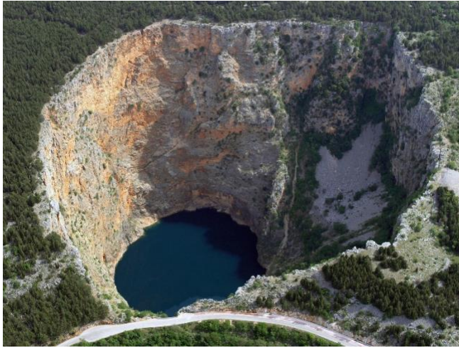
Slika 3: Crveno jezero

Crveno jezero 29 je krška jama ispunjena vodom koja se nalazi nedaleko od Imotskog, ali i Modrog jezera. Dobilo je naziv po stijenama crvene boje koje okružuju jezero. Crveno jezero je osim po crvenim stijenama poznat i po svojoj dubini pa je tako Hrvatski speleološki savez 1998. godine izmjerio visinsku razliku od 528 metara, a dubina jezera je tada iznosila 287 m što ga čini jednim od najdubljih jezera u Europi.