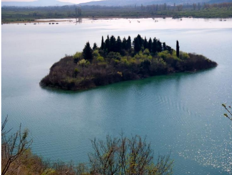
Slika 6: Otočić Manastir u Prološkom blatu