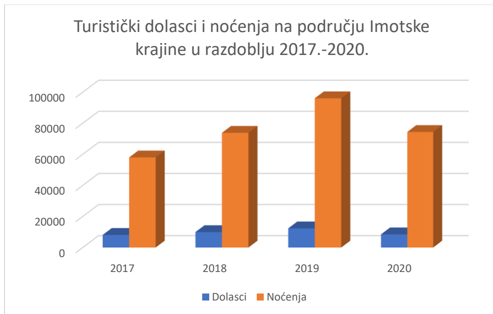
Grafikon 2 : Broj dolazaka i noćenja na području Imotske krajine u razdoblju od 2017.-2020. godine

Na sljedećem grafikonu prikazan je broj dolazaka i noćenja na području Imotske krajine u razdoblju od 2017.-2020. godine.