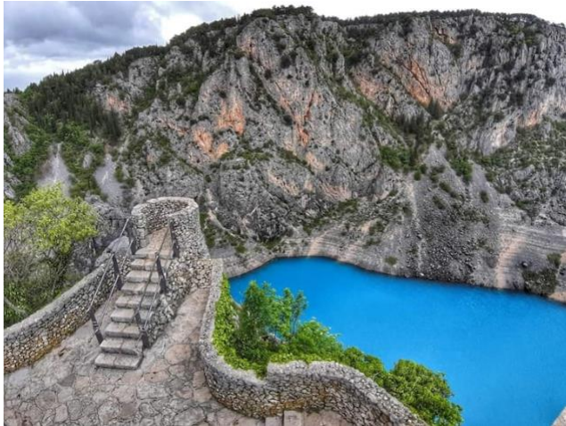
Slika 2: Modro jezero

Modro jezero 28 je najvažnija prirodna atrakcija Imotske krajine koja zbog svoje ljepote privlači brojne turiste. Nalazi se uz sam rub grada Imotskog te je naziv dobio zbog modre boje vode koja se u njemu nalazi. Razina vode Modrog jezera neprestano varira ovisno vremenskim prilikama, tj. kišnim danima te je tako moguće da u Modrom jezeru dođe do presušenja, ali i do najveće izmjerene dubine od 147 m.