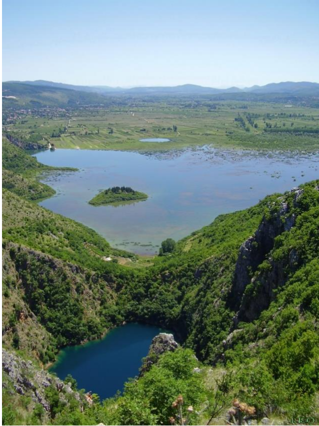
Slika 5: Jezero Galipovac i Prološko jezero