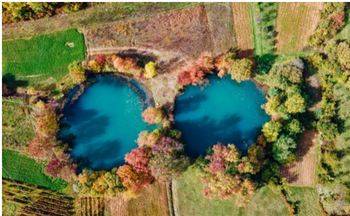
Slika 7: Jezera Dva oka

Jezera Dva oka su jedan od izvora rijeke Vrljike smješteni u općini Proložac, kružnog oblika koji nikada ne presušuju. Sjeverno jezero je promjera 42 m i duboko 12 m dok je južno promjera 44 m i dubine 6 m. 33