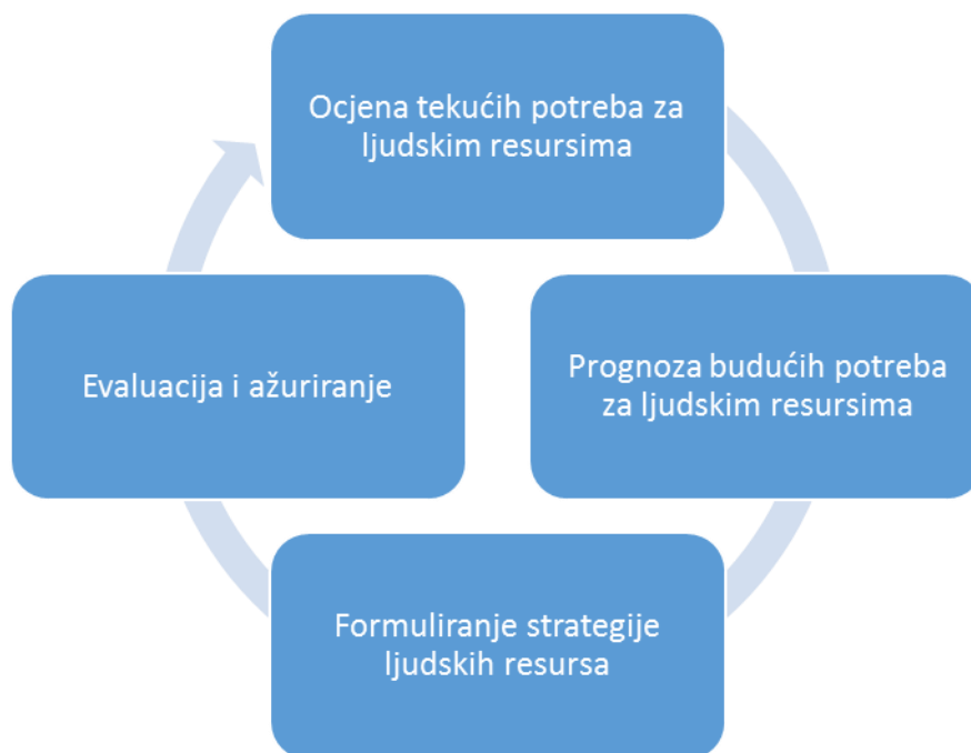
Slika 1 : Bazni model sustavnog planiranja ljudskih resursa.

Izvor: Buble,M. :Menadžment, Sinergija, Zagreb, 2006.god, str. 370. 4