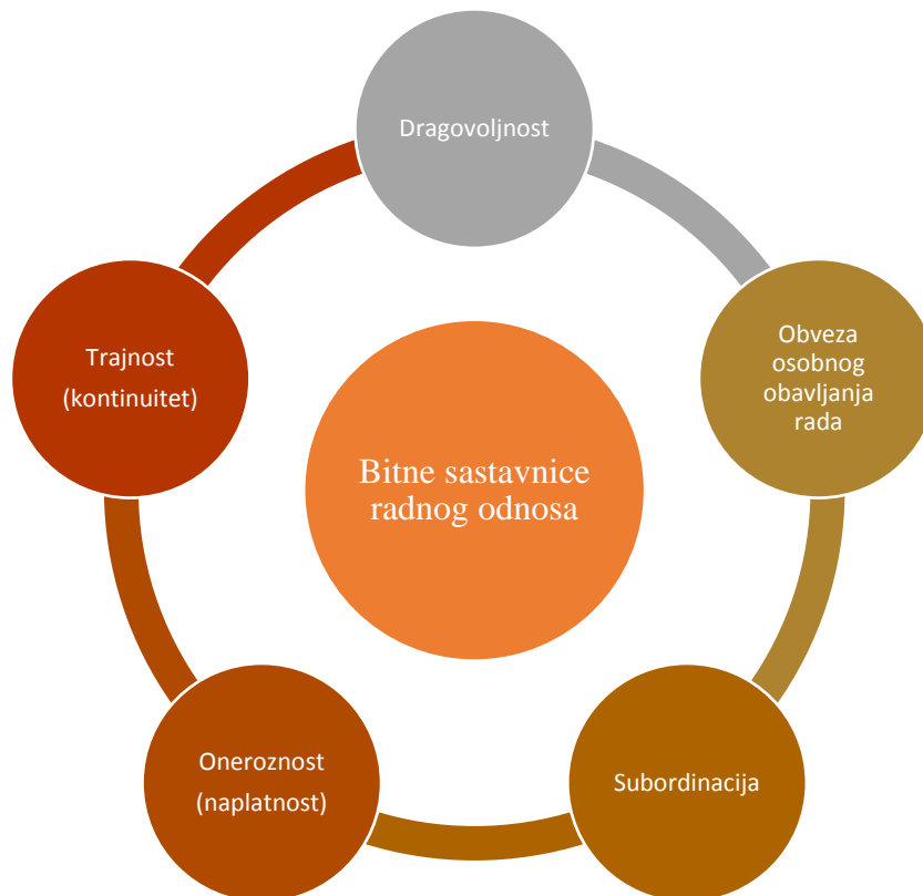
Slika 1: Bitne sastavnice radnog odnosa