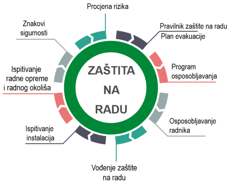
Slika 3 Mjere zaštite na radu