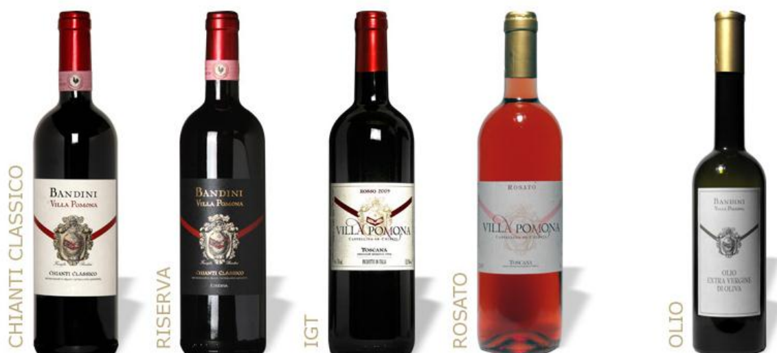
Slika 23. Vina Pomona