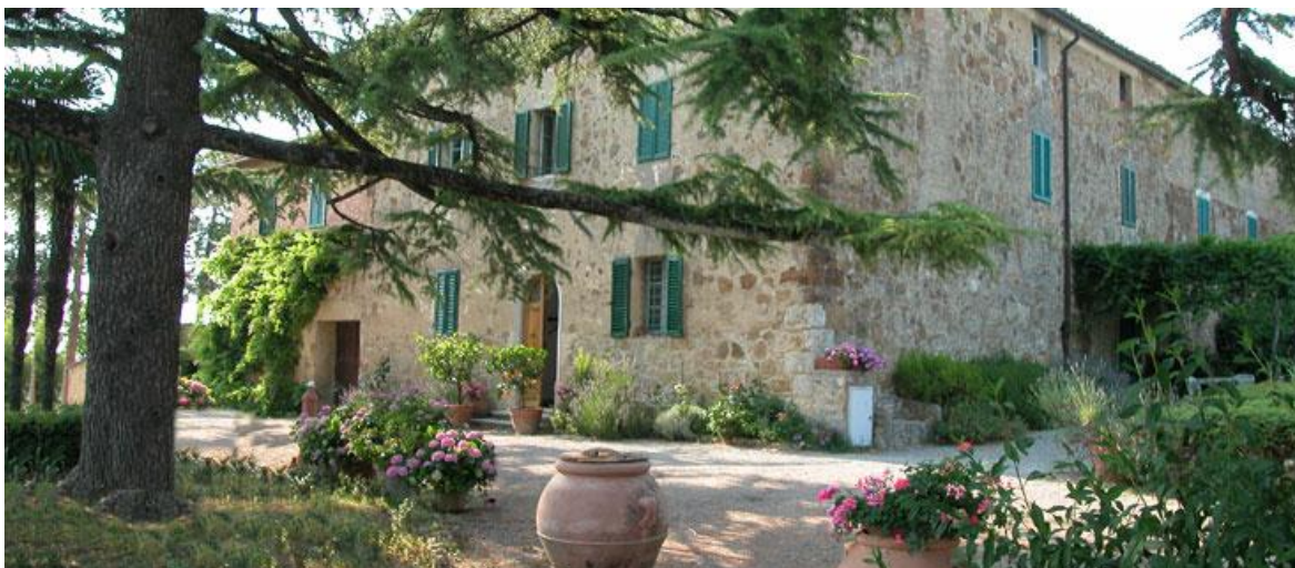
Slika 22. La Villa