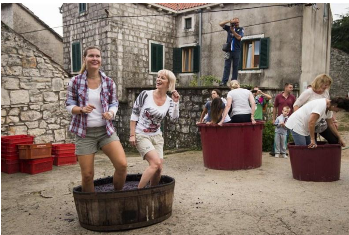
Slika 2. Sudjelovanje turista u pravljenju vina