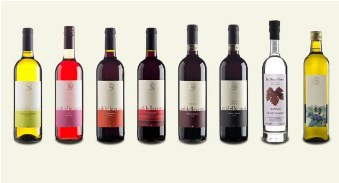
Slika 20. Proizvodi vinarije Val delle Corti

Izvor: http://valdellecorti.it/it/home-page.html , 02.09.2016.