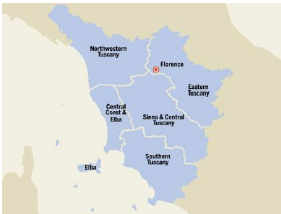
Slika 6. Položaj Toscanne u Italiji