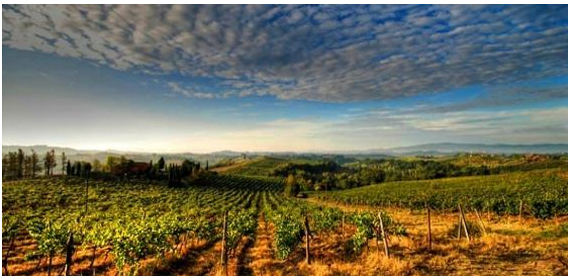
Slika 13. Toskanski vinograd