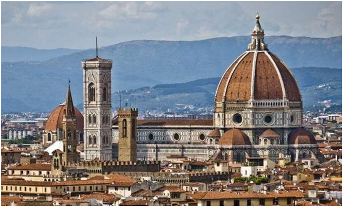
Slika 8. Firentinska katedrala