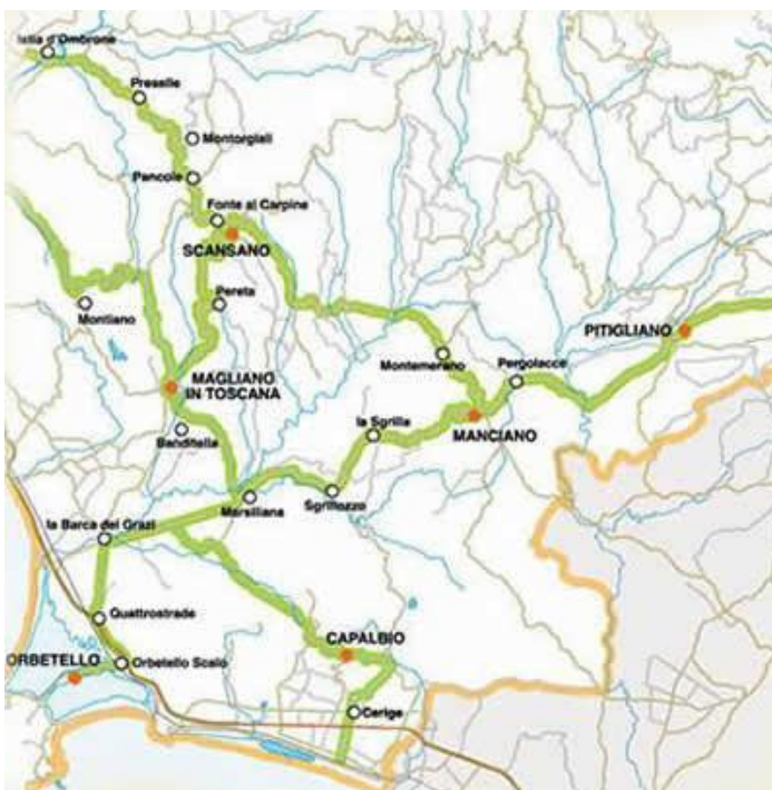
Slika 15. Vinska cesta Colli di Meremma

Colli di Maremma vinska cesta se nalazi u najjužnijem dijelu Toscanie. Ove ceste se nalaze južno od Grosseto na samom dnu u regiji. Područje je poznato po svojim plažama i termalnim vrućim izvorima. Za ljubitelje vina, četiri vina su sa ovog dijela Toscanie: Ansonica, Morellino od Scansano, Parrina i Pitigliano.