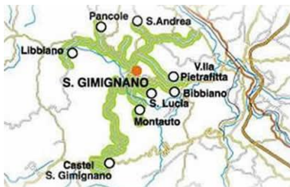
Slika 16. Vinska cesta San Gimignano

San Gimignano vinska cesta je poznata po svojem Vernaccia zlatno-bijelom vinu, koje je suho i pitko. Zanimljivosti ovog puta čine farme šafrana koji se nalaze između redova vinograda i maslinika. Ljubitelji povijesti će se naći srednjovjekovni gradić San Gimignano. Također može se uživati u sjajnim crnim vinima kao Colli Senesi Chianti Classico koji su proizvedeni na ovim tim cestama.