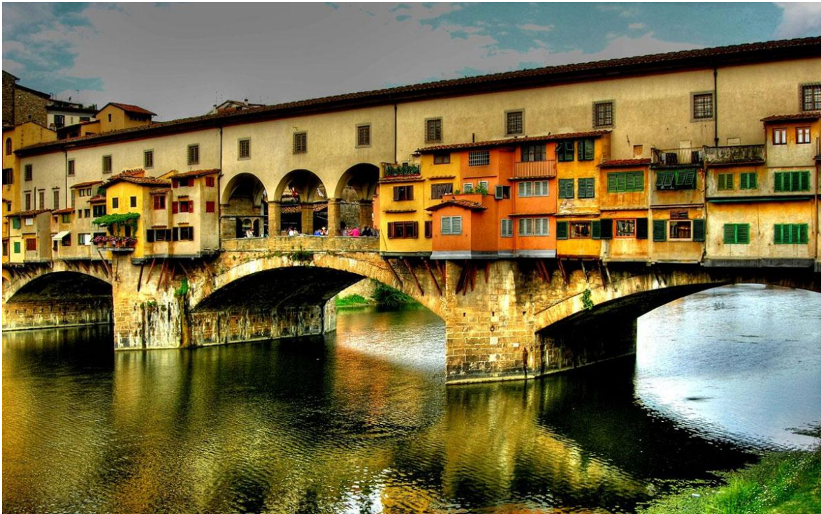
Slika 9. Ponte Vecchio