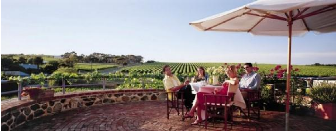
Slika 1. Enoturizam