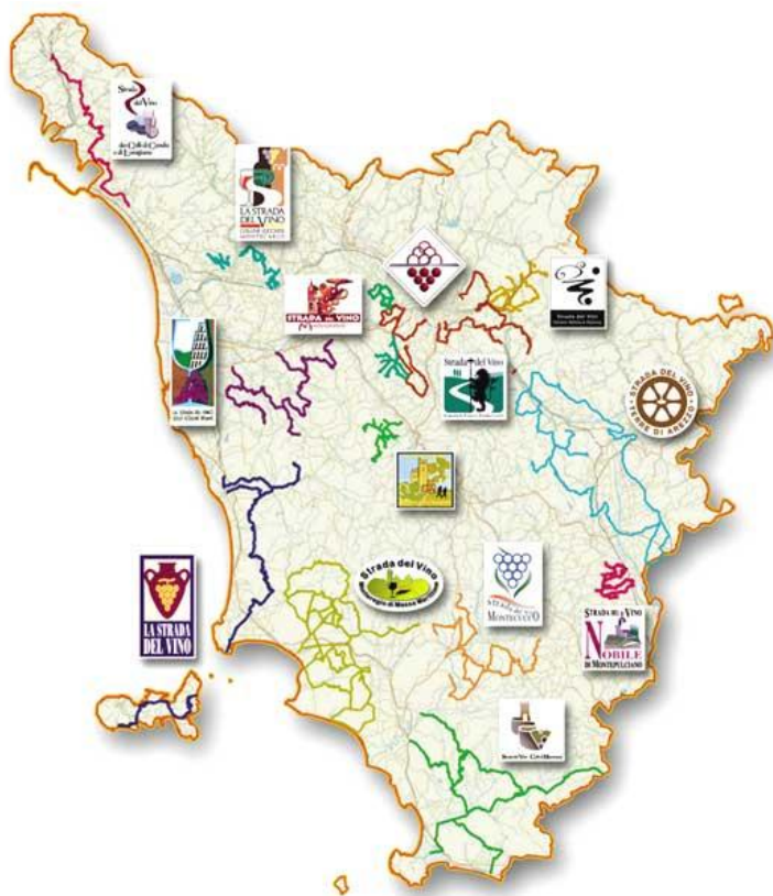
Slika 14. Toskanske vinske ceste