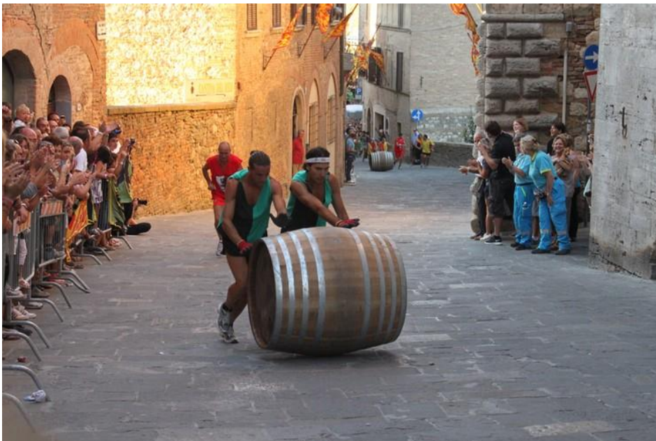
Slika 17. Festival Bravio delle Botti