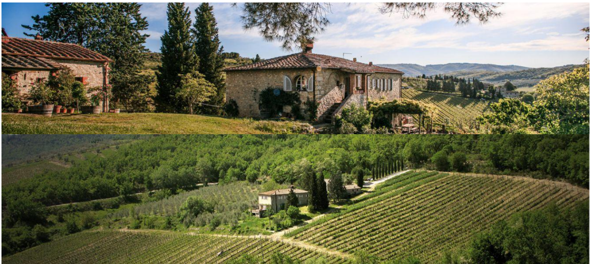
Slika 18. Val delle Corti