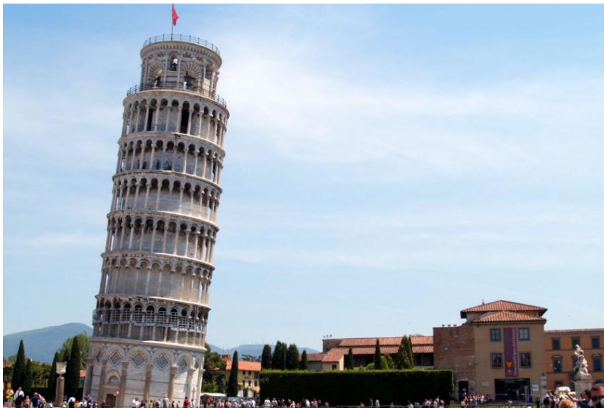
Slika 10. Kosi toranj u Pisi