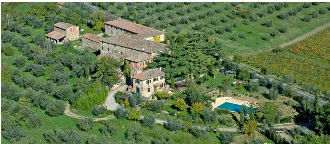
Slika 21. Pomona