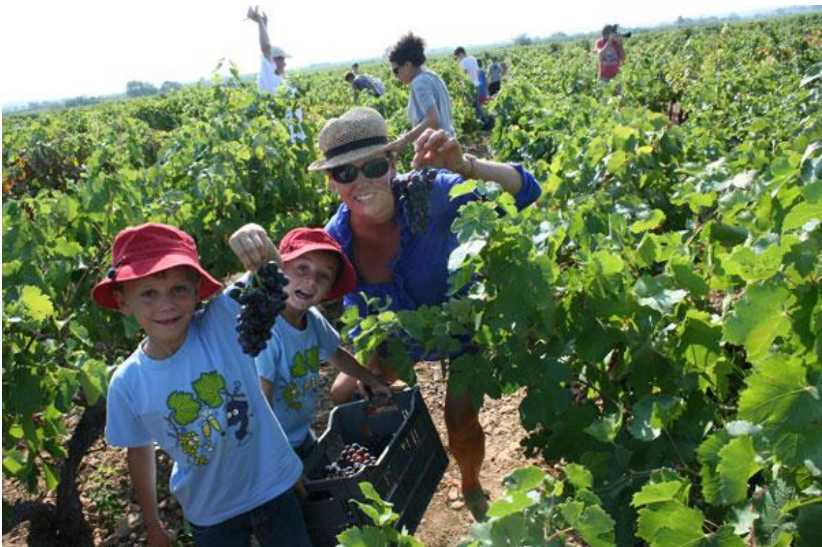
Slika 4. Sudjelovanje turista u branju grožđa