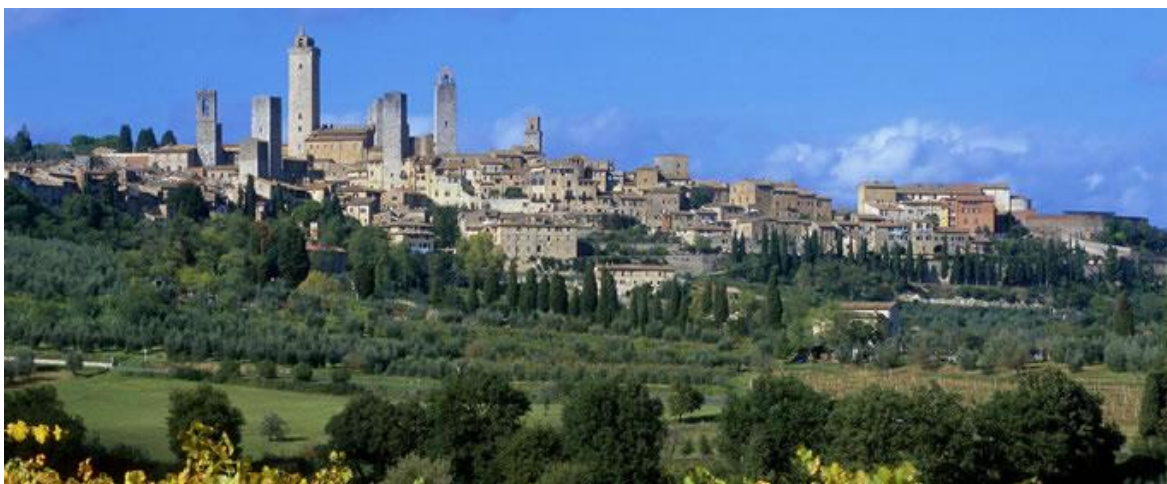
Slika 12. San Gimignano