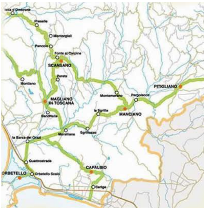
Slika 15. Vinska cesta Colli di Meremma

Colli di Maremma vinska cesta se nalazi u najjužnijem dijelu Toscani. Ove ceste se nalaze južno od Grosseto na samom dnu u regiji. Područje je poznato po svojim plažama i termalnim vrućim izvorima. Za ljubitelje vina, četiri vina su sa ovog dijela Toscani: Ansonica, Morellino od Scansano, Parrina i Pitigliano.