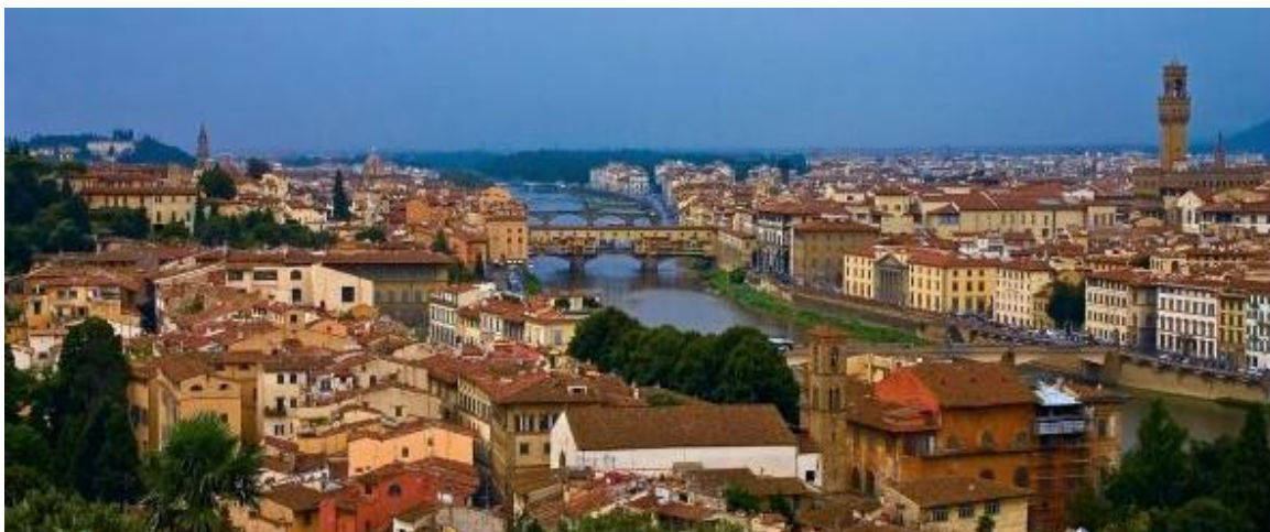
Slika 7. Povijesni centar Firence