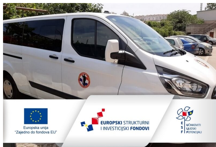
Slika 8 – Objava dostavljenog vozila uz obvezne elemente vidljivosti