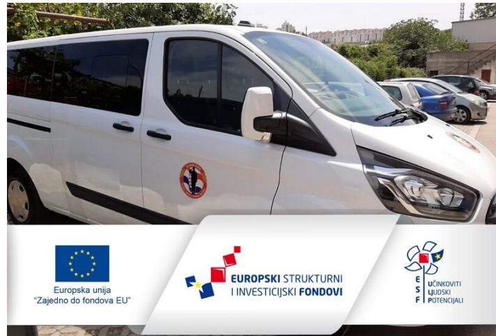
Slika 8 – Objava dostavljenog vozila uz obvezne elemente vidljivosti