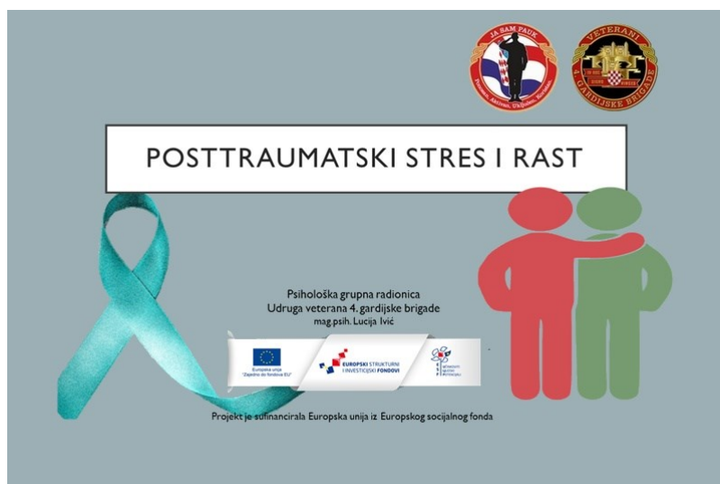
Slika 7 – Obavijest o održavanju šeste radionice psihosocijalne pomoći

Psihologinja Lucija Ivić održala je i šestu grupnu radionicu „Posttraumatski stres i rast“ 9. studenog 2020. Radionica je održana s osvrtnom sudionika na iskustvo sudjelovanja u ratu te mogućim posljedicama istoga na cjelokupno zdravlje pojedinca. Posebna pažnja posvećena je boljem razumijevanju simptoma posttraumatskog stresnog poremećaja (PTSP). Sudionici su mogli procijeniti vlastite promjene kroz vrijeme glede osobne snage, socijalnih odnosa te životnoj filozofiji i podijeliti vlastita iskustva posttraumatskog rasta. Na radionici je također primijenjen upitnik.