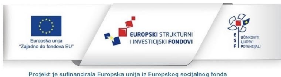
Slika 1 - Primjer vidljivosti oznaka kod komuniciranja projekta s javnošću