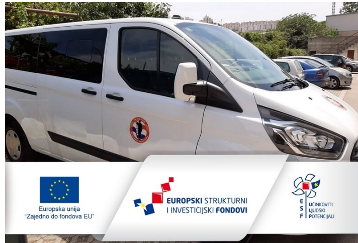
Slika 8 – Objava dostavljenog vozila uz obvezne elemente vidljivosti