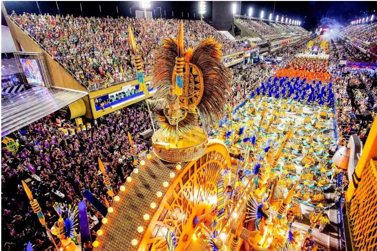
Slika 5: Predstavljanje točke škole sambe tijekom parade na sambodromu u Rio de Janeiru

Prodaju ulaznica organizira LIESA (Nezavisna liga škola sambe), koja će često dan prije najavi stavljanje ulaznica na prodaju. Najniža cijena ulaznice iznosi otprilike 250 američkih dolara. Turistički agenti ih kupuju i preprodaju često po znatno višoj cijeni pritom nudeći brojne pogodnosti. U isto vrijeme mjesta u VIP sektoru iznose i po nekoliko tisuća dolara gledateljima pružajući jednostavan pristup brojnim sadržajima, kao što je otvoren bar, večere od tri slijeda itd. Unatoč visokim cijenama, ulaznice i neki hoteli često se rasprodaju mjesec dana unaprijed.