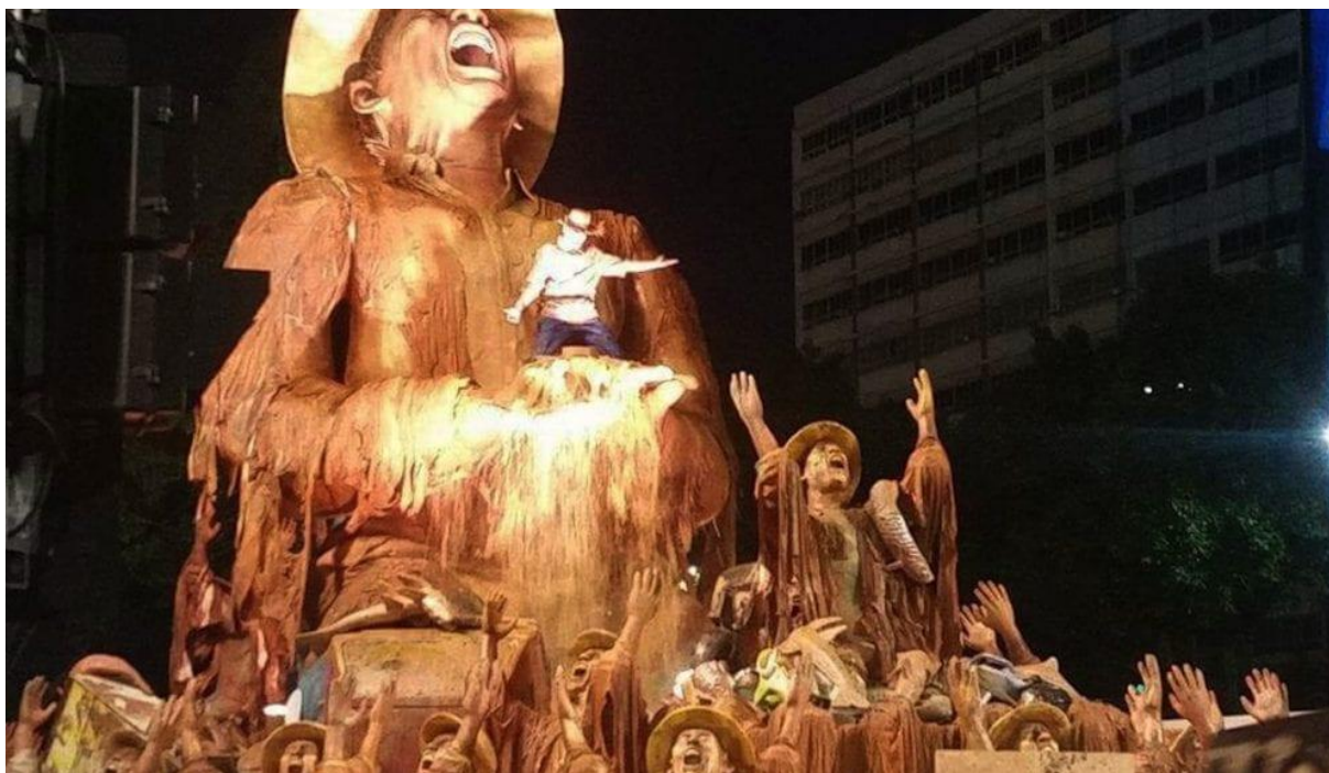
Slika 8: Povorka škole sambe Portela 2016.

Pobjednik karnevalske povorke 2016. godine, škola sambe Portela, odabrala je rijeke kao svoju temu. Kako tvrde: “Kroz njih prolaze mnoge priče i one čuvaju tajne voda koje su rodile svijet”. S natpisom " rijeka koja je bila slatka ", škola sambe odustala je od tipičnih jarkih boja karnevala i upotrijebila smeđu u znak sjećanja na tragediju u regiji Minas Gerais. Divovska figura ribara, boje mulja, predstavljala je žaljenje za svim onim što je izgubljeno u nesreći.