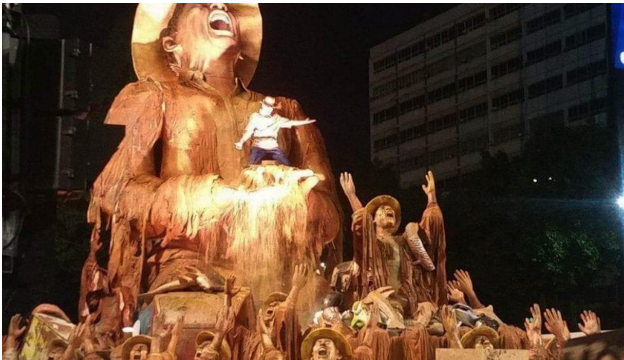
Slika 8: Povorka škole sambe Portela 2016.

Pobjednik karnevalske povorke 2016. godine, škola sambe Portela, odabrala je rijeke kao svoju temu. Kako tvrde: “Kroz njih prolaze mnoge priče i one čuvaju tajne voda koje su rodile svijet”. S natpisom " rijeka koja je bila slatka ", škola sambe odustala je od tipičnih jarkih boja karnevala i upotrijebila smeđu u znak sjećanja na tragediju u regiji Minas Gerais. Divovska figura ribara, boje mulja, predstavljala je žaljenje za svim onim što je izgubljeno u nesreći.