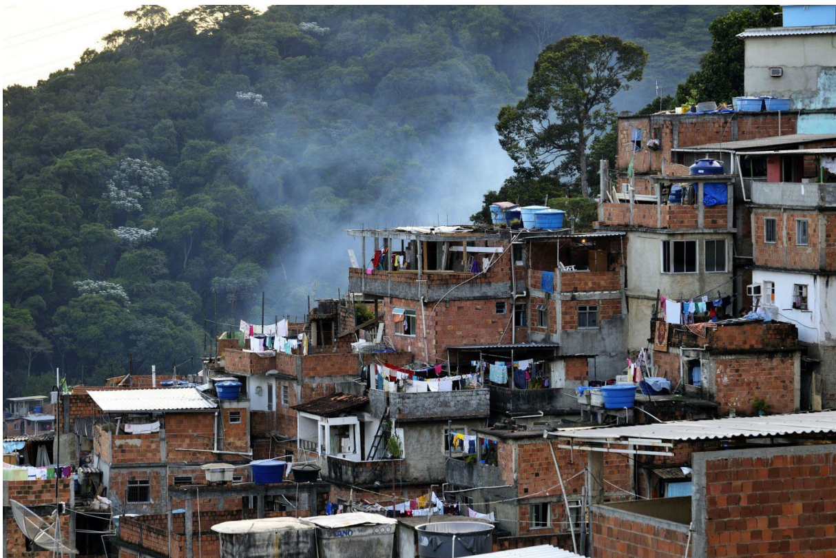
Slika 7: Favela u Rio de Janeiru

U Brazilu 50 milijuna stanovnika živi u neprihvatljivim stambenim objektima i teškim životnim uvjetima. Takva situacije je rezultirala širenjem sirotinjskih stambenih četvrti. Zbog nedostatka prostora i sredstava, milijuni obitelji su primorani izgraditi domove od otpadnog materijala. Navedena naselja zovu se favele, a često se nalaze na periferijama velikog grada. Rocinha, najveća favela u Brazilu, nalazi se upravo u Rio de Janeiru, a dom je nekoliko desetaka tisuća stanovnika. U favelama su često prisutne visoke stope bolesti, kriminala, nasilja bandi i nezaposlenosti.