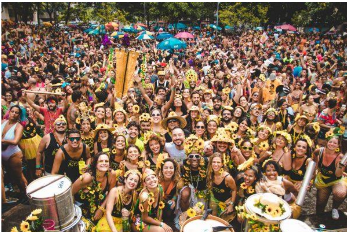
Slika 3: Kwartovska zabava za vrijeme karnevala u Rio de Janeiru