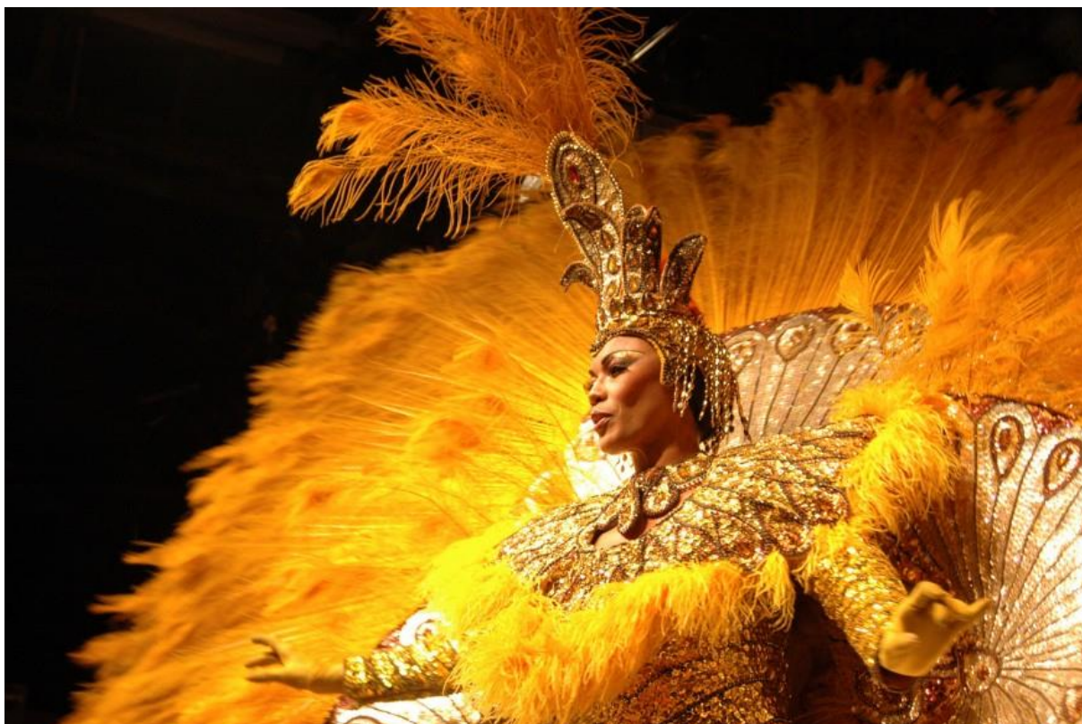
Slika 4: Plesačica sambe