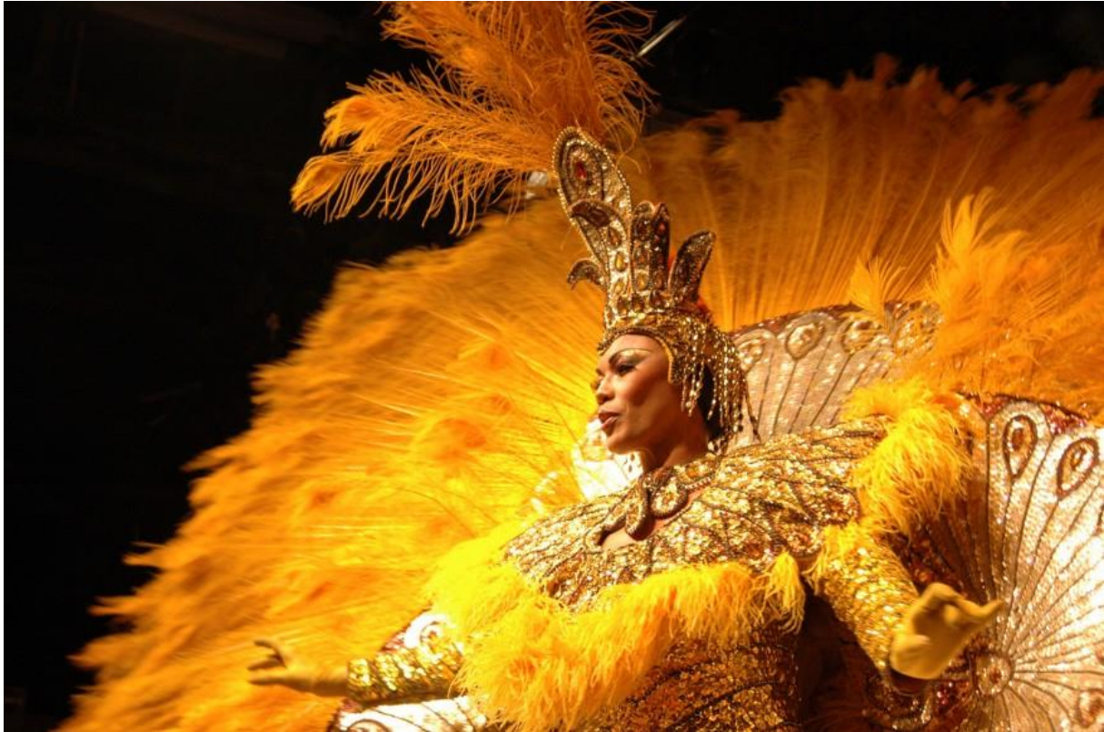
Slika 4: Plesačica sambe