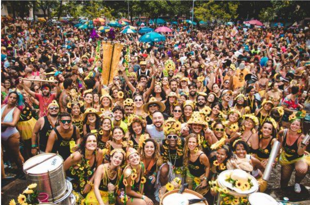
Slika 3: Kwartovska zabava za vrijeme karnevala u Rio de Janeiru

Izvor: free walker tours, https://freewalkertours.com/carnaval-in-rio-de-janeiro-2020/