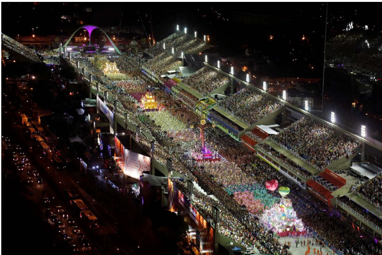
Slika 6: Sambodrom Marquês de Sapucaí u Rio de Janeiru

Podaci nevladinih organizacija za karneval 1999. pokazuju da su većinu zabavnih sadržaja proizvele nevladine organizacije. Službena parada održava se od 1984. godine u trajno izgrađenom području poznatom kao "Sambodrom" u središtu Rio de Janeira. Sambodrom predstavlja otvorenu strukturu sastavljenu od ulica poredanih sa po dva reda sjedala i svlačionica, te na samom kraju pozornicom. Potonja je ukrašena betonskom skulpturom međunarodno priznatog arhitekta Oscara Niemeyera s namjerom da nalikuje na „oblina Brazilke“.