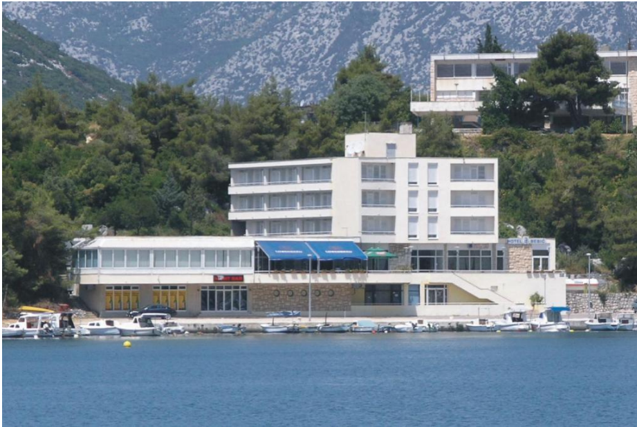
Slika 9. Hotel Bebić