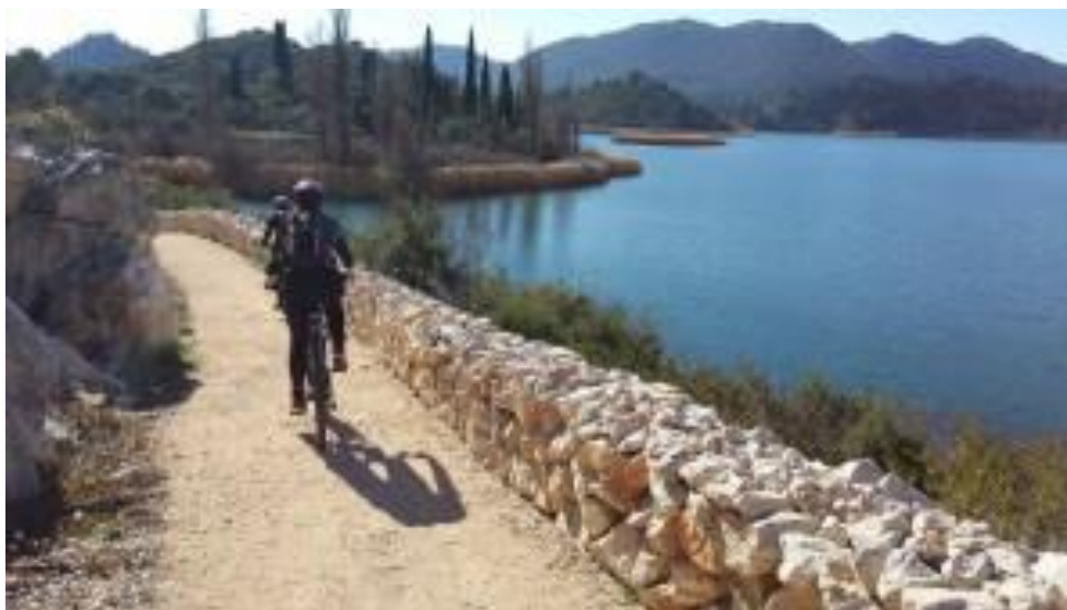
Slika 3. Biciklistička staza Baćinska jezera

Baćinska jezera smatraju se oazom mira te su odlična lokacija za sve ljubitelje prirodnih ljepota. Savršena su za odmor duše i tijela. Što se aktivnosti tiče, dostupne su kajak ture, paddle surf ture te ture lađom kojom se može razgledati čak šest jezera. Baćinska jezera okružuje oko 15 kilometara duga makadamska biciklistička staza. Ona povezuje pet od sedam Baćinskih jezera te se smatra jednom od glavnih atrakcija za turiste koji posjete Baćinska jezera.