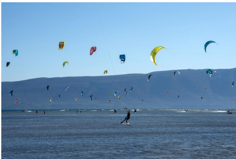
Slika 1. Kiteboarding na Neretvi

Na području rijeke Neretve nude se brojne aktivnosti poput foto safarija, kajakinga, kiteboardinga te jedrenja na daskama. Također, jedna od najpoznatijih aktivnosti smatra se promatranje ptica, odnosno 'bird watching' gdje se pomoću dalekozora i raznih teleobjektiva promatra preko 150 različitih vrsta ptica od kojih se mnoge smatraju ciljnim vrstama područja Delta Neretve. Od prirodnih posebnosti, treba izdvojiti najprije značajni krajobraz „Područje Modrog Oka i jezera uz naselje Desna”. Radi se o djelomično potopljenoj krškoj depresiji na desnoj obali rijeke Neretve. To područje okarakterizirano je obiljem vode i močvarnih staništa, te je također važno za zimovanje i seobu prica te sadrži ugrožena staništa (Smart City Ploče, 2020).