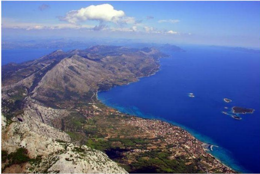
Slika 5. Vrh Sveti Ilija