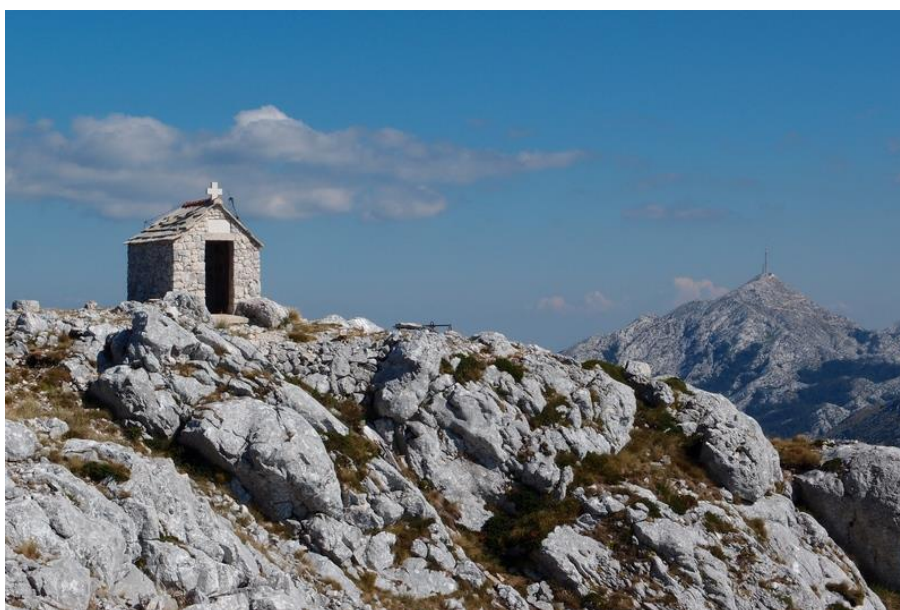
Slika 4. Vrh Sveti Ilija

Najveća je planina u Dalmaciji i završava samo nekoliko kilometara od Grada Ploča. Najviši južni vrh masiva Biokovo je Sveti Ilija (773m) do kojega se može doći stazom koja počinje kod Baćinskih jezera. Sat vremena vožnje od Ploča nalazi se Park prirode Biokovo poznat po izuzetnim biološkim raznolikostima te po najvišem vrhu Dalmacije (Sv. Jure) (Smart City Ploče, 2020).