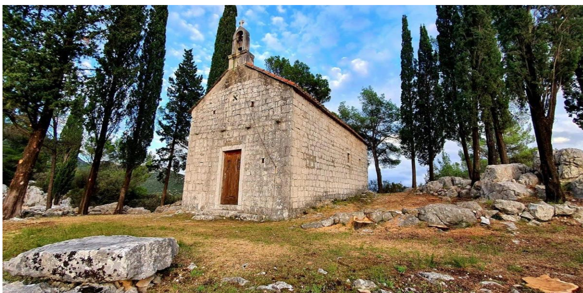
Slika 6. Crkva sv. Luke