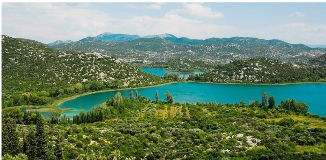
Slika 2. Baćinska jezera

Povezivanjem Baćinskog jezera pod imenom Sladinac preko tunela sa morem, 1912. godine bitno se promijenio ekosustav Baćinskih jezera na način da se razina jezera snizila za otprilike 12 m. Drugi tunel koji spaja Baćinsko jezero Podgoru s Vrgoračkim poljem izgrađen je 1938. godine te je napravljen kako se nebi događale poplave Vrgoračkog polja (Ivičić i Pavičić, 1996).