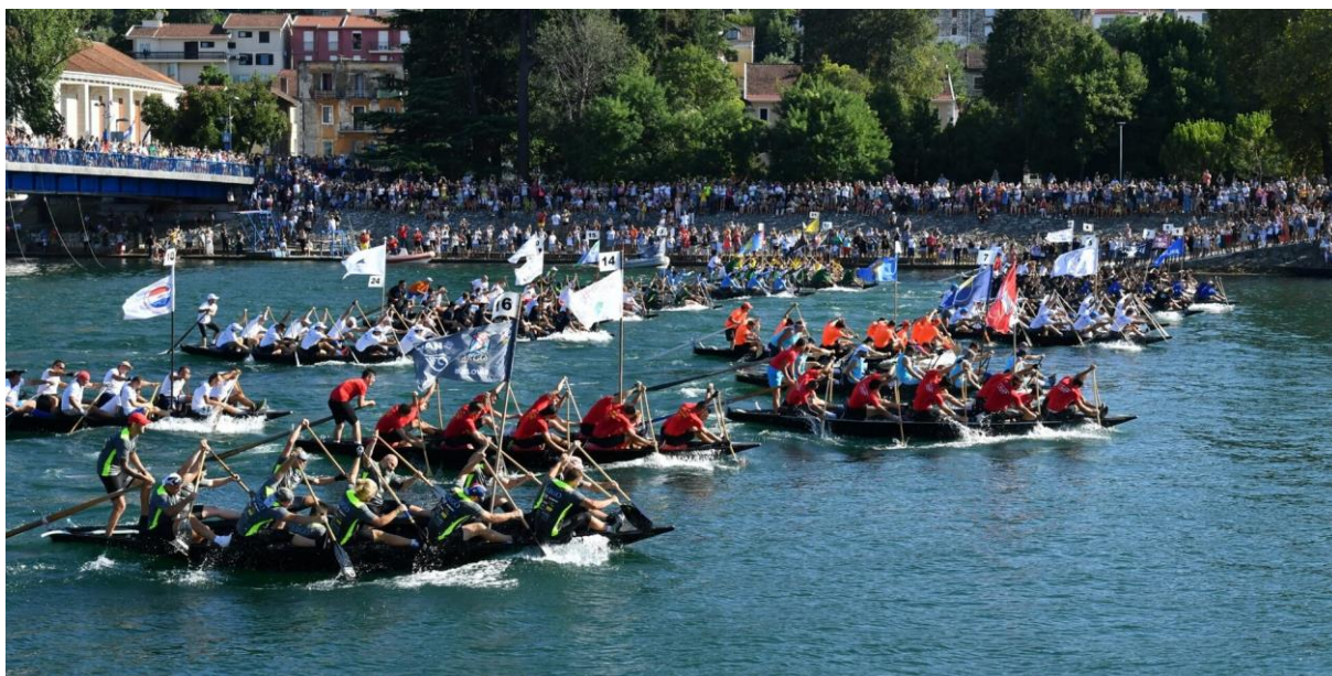
Slika 7. Maraton lađa

U Pločama, najznačajnijim turističkim događajem smatra se „Maraton lađa” koji se održava u spomen neretvanskih gusara. Tradicionalna utrka održava se još od 1998. svako ljeto druge subote u mjesecu kolovozu. U prosjeku preko 600 natjecatelja svake godine, odnosno otprilike 35 posada. Put koji lađari moraju prijeći dug je svega 23 kilometra, a prosječno vrijeme iznosi 2 sata i 15 minuta. Polazište je u Metkoviću, a završetak je u Pločama. Ovaj događaj popraćen je uživo preko desetak tisuća gledatelja. Pobjednička lađa osvaja zlatnu medalju te štit kneza Domagoja koji teži 27 kilograma te novčanu nagradu. Mjesto iz kojeg potječe pobjednička posada, nedugo nakon pobjede organizira tzv. „Noć prvaka” gdje se organizira fešta i koncert (Musulin, 2015).