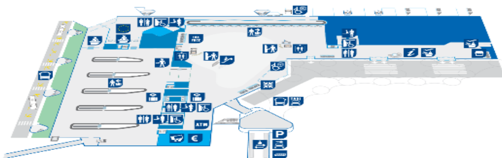
Slika broj 1: Interaktivna karta zračne luke Split