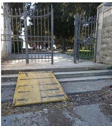
Slika broj 10: Nepristupačan ulaz u park Sustipan