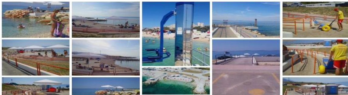
Slika broj 7: Plaža prilagođena za osobe sa invaliditetom na Žnjanu

Plaža ima dvije rampe za ulazak u more, 10 parkirnih mjesta namijenjenih osobama s invaliditetom te pristupnu rampu od parkinga do plaže. Spasioci dežuraju od trenutka otvaranja plaže kako bi pomogli posjetiteljima u korištenju svih njenih sadržaja, uključujući pristup moru, svlačionicama i toaletu. Dodatno, tu su stepenice i lift za ulazak u more. Kako bi se što više ljudi uključilo u ljetne aktivnosti, nastojalo se udovoljiti potrebama osoba s različitim stupnjevima oštećenja(Splitska obala, 2019).