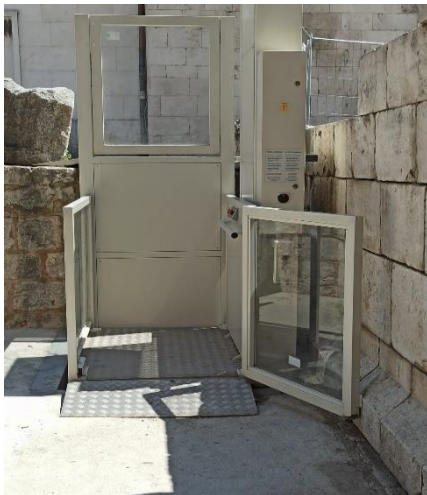
Slika broj 3: Vertikalno podizna platforma kod Srebrenih vrata Dioklecijanove palače

Srebrna ili Istočna vrata , kako im ime kaže, nalaze se na istočnom zidu palače, a kroz ova vrata dolazi se na tržnicu Pazar koji je pristupačan za osobe koje se kreću u invalidskim kolicima. Ulaz kroz Srebrna vrata za osobe s invaliditetom nije bio pristupačan sve do 2019. godine kada se na istočnom ulazu postavila vertikalno podizna platforma. Platforma je rezultat projekta USEFALL – Unesco Site Experience For All čiji cilj je osiguravanje veće dostupnosti kulturne baštine u UNESCO gradovima(Grad Split, 2019). Vertikalno podizna platforma se koristi kao element pristupačnosti za potrebe svladavanja visinske razlike veće od 120 cm u unutarjem ili vanjskom prostoru, kada se isto ne rješava pristupačnim dizalom ili drugim elementom pristupačnosti, a mora imati: nastupnu plohu platforme veličine najmanje 110 × 140 cm, bočne stranice platforme zatvorene do visine od 120 cm, ulazna vrata širine svijetlog otvora najmanje 90 cm koja se otvaraju posmično ili zaokretno prema van te oznaku pristupačnosti(Narodne Novine, 2013).