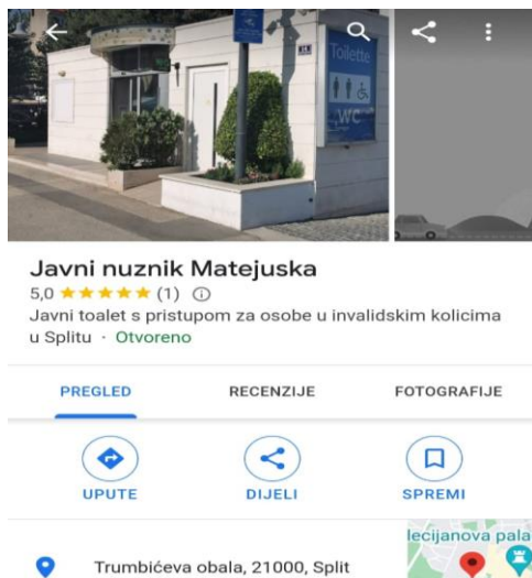
Slika broj 11: Lokacije javnih toaleta sa pristupom za osobe s invaliditetom u centru grada Splita