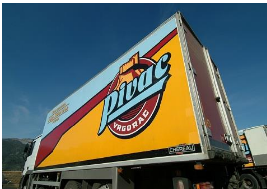
Slika 8: Vozni park

Svaka mesnica ima minimalno 2 klime te nekoliko rashladnih uređaja u kojima stoje naši proizvodi, ovisno o kvadraturi. A kada je riječ o kvadraturi to je obično 15-20 metara kvadratnih ako se mesnica nalazi u centru grada, a na svim ostalim mjestima je riječ od 30 do 50 kvadrata.