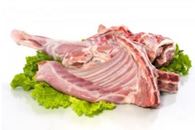
Slika 5: Proizvodni asortiman - svježe meso