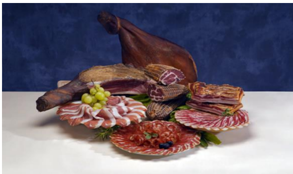
Slika 7: proizvodni asortiman – mesne prerađevine

MESNE PRERAĐEVINE - Kao i za sve proizvode Mesne industrije Braća Pivac, i za mesne prerađevine se koriste stari obiteljski recepti uz najnovije tehnologije kako bi vjernim kupcima ponudili najbolji spoj tradicije i svježine.