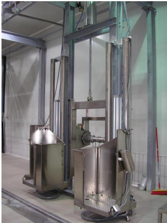
Slika 9: Pneumatski stroj za skidanje kože goveda

Proizvodni pogoni koji se nalaze u Vrgorcu i Zavojanima, opremljeni su najsuvremenijom tehnologijom koja je uz tradiciju i znanje koje se prenosi i razvija generacijama jamac najbolje kvalitete proizvoda. Primjena najbolje tehnologije počinje već kod uzgoja stoke a nastavlja se u pogonima za preradu.