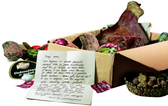
Slika 6: Proizvodni asortiman – suhomesnati proizvodi