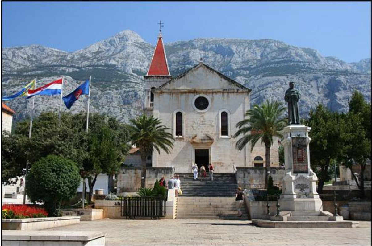
Slika 6: Kačićev Trg i Crkva Sv. Marka