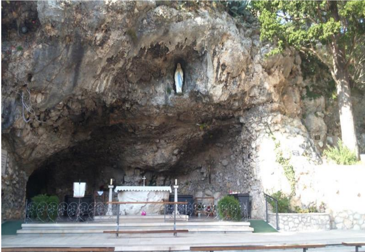
Slika 4: Vepric

hodočasnički dani su 15. kolovoza na dan Velike Gospe, 7. i 8. rujna, 25. ožujka i 11. veljače. Svete Mise se održavaju svaki dan u 18:00, a nedjeljom se uvodi i jutarnja misa u 09:00.