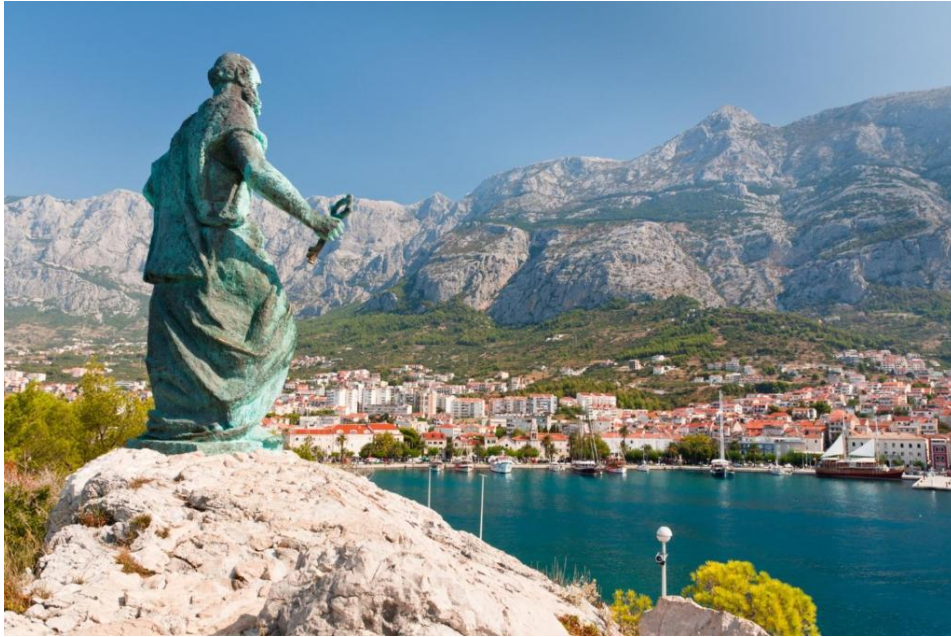
Slika 5: Skulptura posvećena Sv. Petru