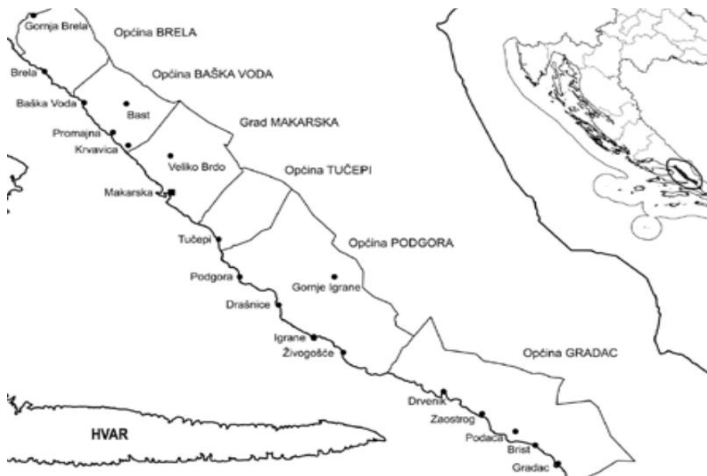
Slika 1: Naselja i općine