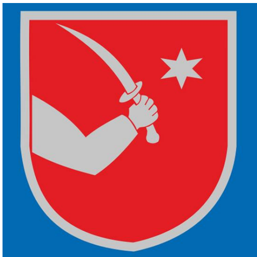
Slika 2: zastava i grb grada

Godine 1755. izgrađena je „česma sa slikom kamenog grba“ 8 (slika 2), a zastava je postavljena na Kačićevu trgu i na lučkom mulu. Obnovljena je crkva Sv. Petra, a u zaseocima grada nastaju nove manje crkve i relikvije.