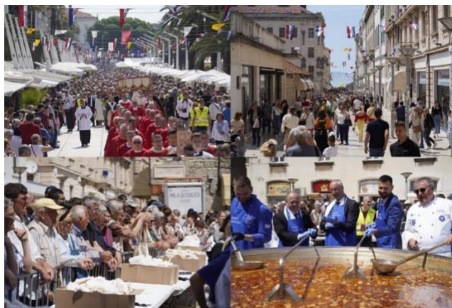
Slika 6. Proslava Sudamje u Splitu 2023.