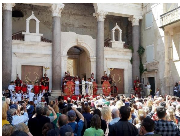
Slika 4. Dani Dioklecijana 2019.