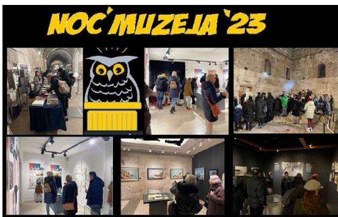
Slika 7. Noć muzeja u Muzeju grada Splita 2023.