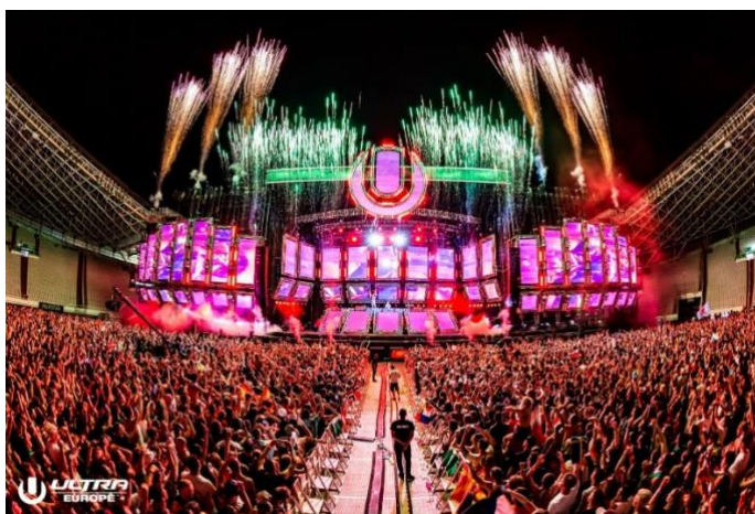
Slika 5. Ultra Music Festival u Splitu (2018.)