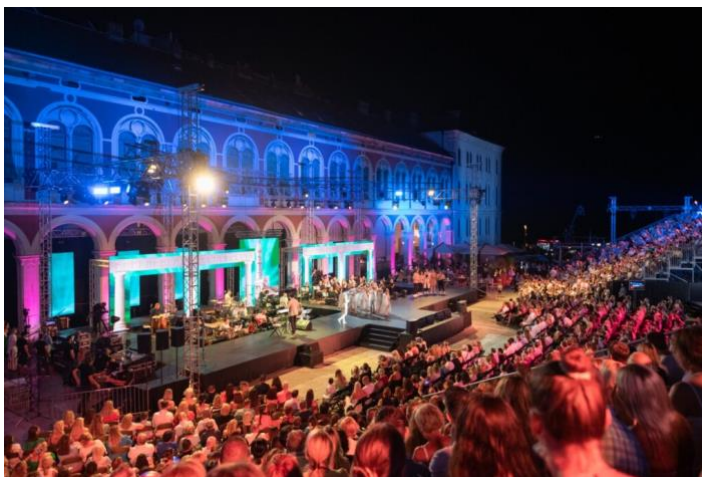
Slika 2. Splitski festival 2022.