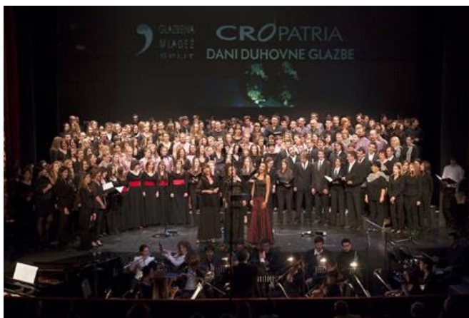
Slika 3. Dani duhovne glazbe Cro Patria 2012.