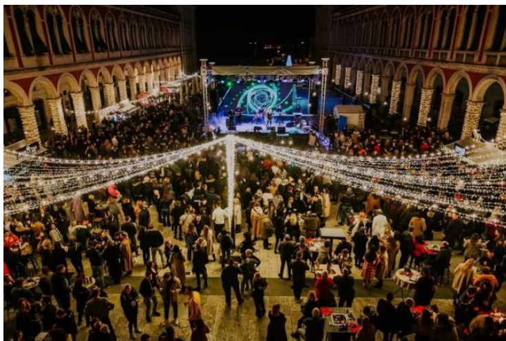
Slika 8. Advent u Splitu na Prokurativama 2022.