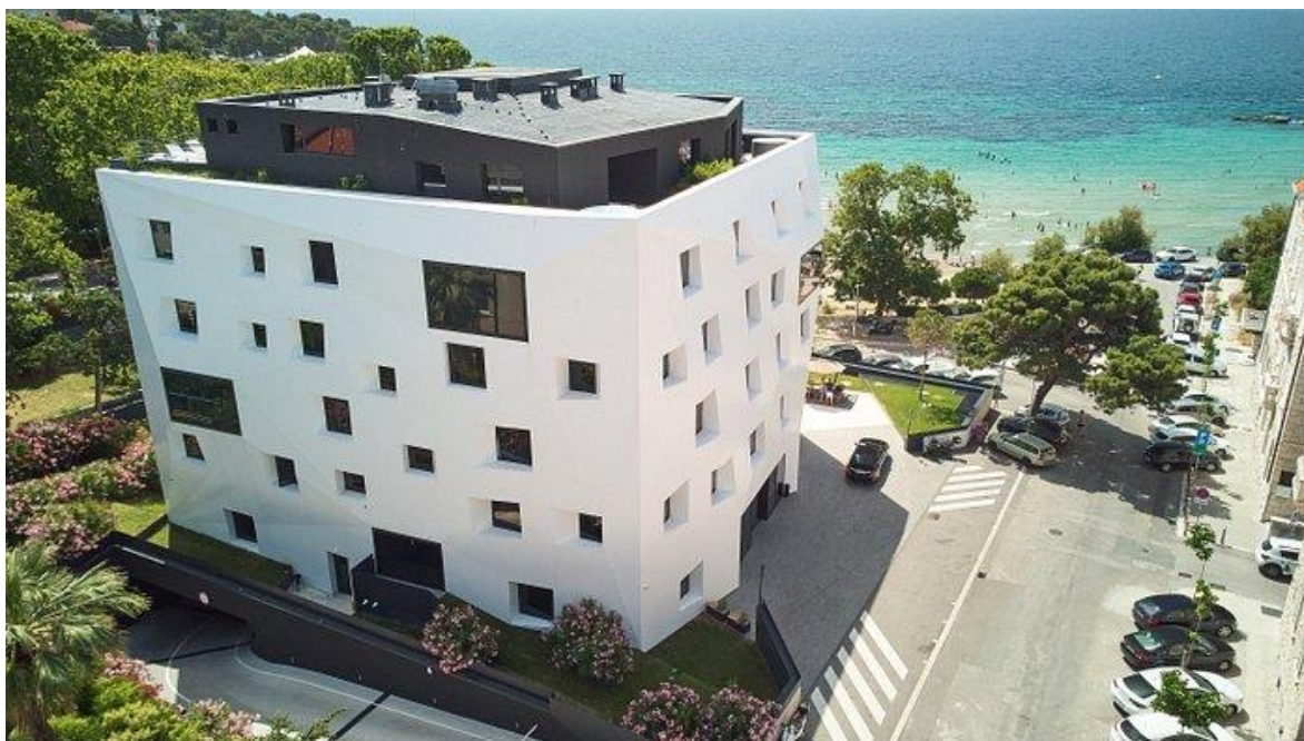
Slika 4 Briig Boutique hotel