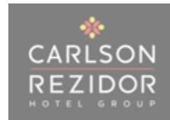
Slika 2. Carlson Rezidor