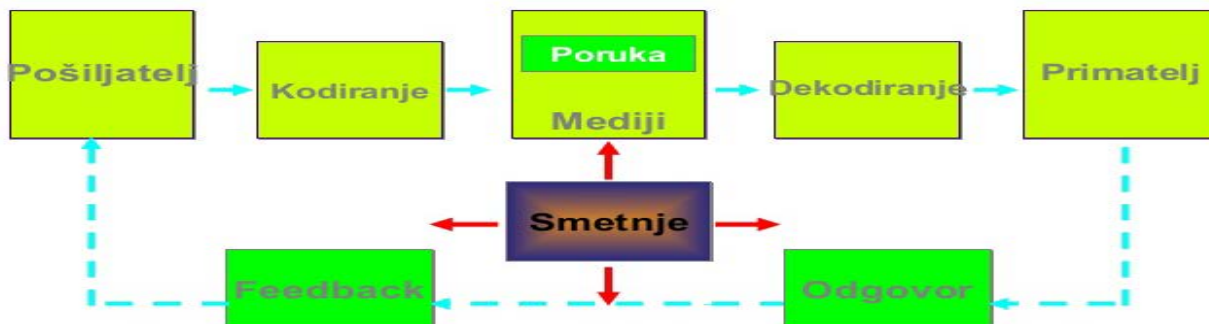
Slika 1. Prikaz komunikacijskog procesa 6

Komunikacija može biti verbalna i neverbalna. Najčešće se isprepliću i pojavljuju zajedno i tako nadopunjuju. Riječi izgovorene određenom intonacijom, praćene izrazom lica, pogledom, držanjem tijela ili pokretima ruku šalju snažnu poruku. Iskustva iz praske