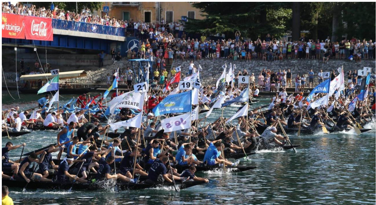
Slika 6. Maraton lađa u Metkoviću, pristup: 15.8.2023. https://metkovic-news.com/sport/26-maraton-lada-veslat-ce-29-ekipa-a-10-maraton-ladarica-12-ekipa/

zabavne glazbe Opuzen „Melodije Hrvatskog juga“, kojima se teži očuvati tradicijske vrijednosti neretvanskog područja. Također, potrebno je istaknuti kako se svake godine održava manifestacija u sklopu Turističke zajednice grada Metkovića i Arheološkog muzeja Naroni pod nazivom „Rimska noć u Naroni“ na kojoj se posjetitelji upoznaju s rimskom mitologijom. Također, svake godine se u kolovozu održavaju Dani Neretvanske kneževine tijekom kojih se održavaju različiti programi, manifestacije i igre u sklopu povezivanja i spajanja različitih kultura i običaja.