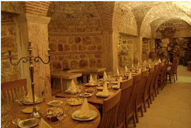
Slika 11: Triklinij vinarije Tomić