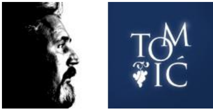
Slika 10: Logo vinarije tomić