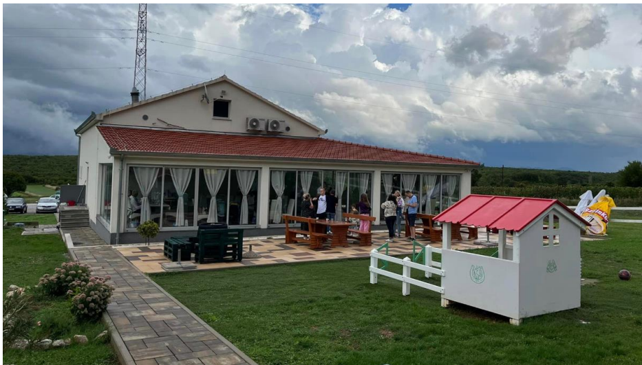
Slika 2. Restoran „Kod Luke“

Restoran „Kod Luke“ (slika 2) smješten u gradu Sinju, ponosi se bogatom ponudom autentičnih dalmatinskih specijaliteta koji oduševljavaju nepce gostiju. Sazan na tradiciji i kvaliteti, restoran „Kod Luke“ pruža jedinstveno iskustvo uživanja u vrhunskoj hrani, ljubaznoj usluzi i ugodnoj atmosferi.