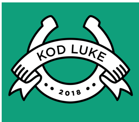
Slika 3. Restoran „Kod Luke“ - logo restorana