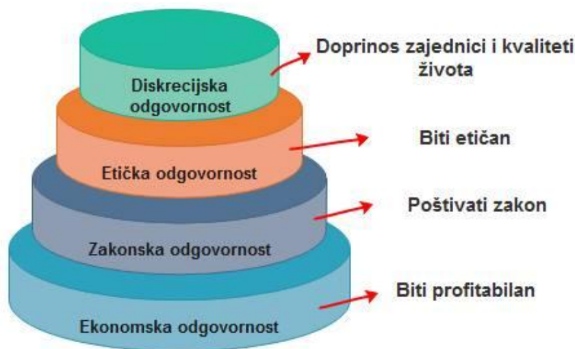
Slika 1: Hijerarhija društvene odgovornosti poduzeća

Izvor: Buble, M. (2006) : Osnove menadžmenta, Ekonomski fakultet, Split, str. 76.