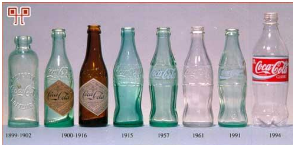
Slika 2: Boca Coca-Cole kroz povijest

Tajna formula Coca Cole ili kako je u kompaniji zovu, "The real thing formula", strogo je čuvana i tek nekolicina ljudi iz najviše hijerarhije u kompaniji zna čarobnu formulu najpoznatijeg napitka u svijetu. Dokument sa tajnim sastojcima strogo je čuvan u trezoru banke u Atlanti. Iako nije vjerojatno da će profesionalni lopovi ići u pothvat krađe običnog dokumenta, tajna je osigurana iz sigurnosti smrtnih slučajaja ljudi koji znaju formulu. Istraživanje Petera Fiska prikazuje razlike u vrijednostima brandova Coca Cole i Pepsi Cole i pokazuje kako je brand najvažnija vrijednost poduzeća. U slijepoj percepciji mnogim ispitanicima je okus Pepsi Cole prihvatljiviji i bolji od okusa Coca Cole no u percepciji sa poznatim brandom pića ispitanici su više preferirali Coca-Colu. Prvi oblik (dizajn) koji je registriran i zaštićen u svijetu je boca Coca Cole. Treba napomenuti i to da je Coca-Cola druga najpoznatija riječ u svijetu nakon izraza OK.