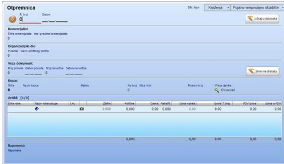
Slika 7: Otpremnica

Otpremnica se sastoji od pet dijelova. Original se šalje kupcu, dvije kopije idu u komercijalno skladište, jedna kopija se šalje u robno knjigovodstvo i jedna kopija ostaje u skladištu. Prilikom preuzimanja robe potrebno je provjeriti pošiljku (količinski i kvalitativno), adresu prodavaonice, vrstu robe i ispravnost robe (Rogošić, 2016).