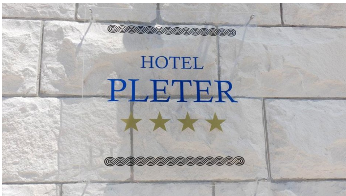
Slika 4. Logo hotela Pleter

Boravak u hotelu je prikladan za sve ljude koji vole more, mir, tišinu i prirodu, a posebno za sve koji se žele opustiti od stresa i užurbanog načina života.