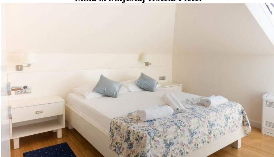
Slika 8. Smještaj Hotela Pleter

Hotel raspolaže sa dva apartmana i 33 sobe koje pružaju nevjerojatan pogled na more, valove, brodice, a to je tako očaravajuće da koji pruža osjećaj kao da je more u sobi. Sobe okrenute prema planini, pružaju apsolutan mir i relaksaciju. Sobe su moderno uređene u bijelo i sadrže: LCD televizor sa satelitskim programima i radiom, klimu, telefon, internet priključak, radni stol, mini bar, kupaonicu s kadom ili tuš kabinom, sušilo za kosu i toaletne potrepštine, a na raspolaganju su fitness i sauna.