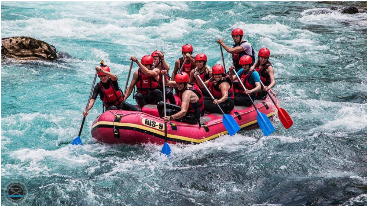
Slika 9. Rafting na rijeci Cetini