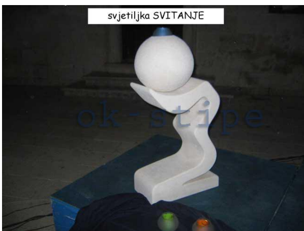
Slika 10: Svjetiljka Svitanje