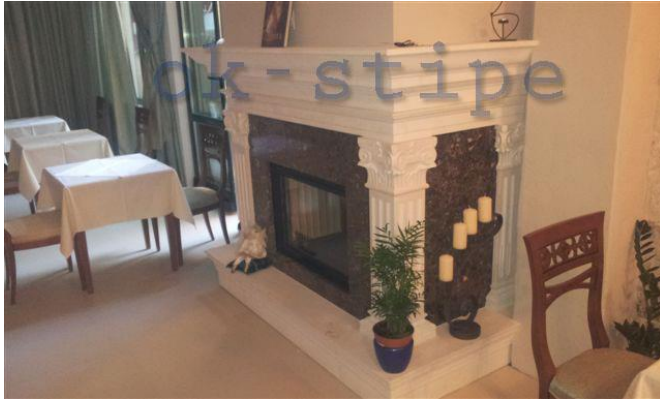
Slika 8: Kamin