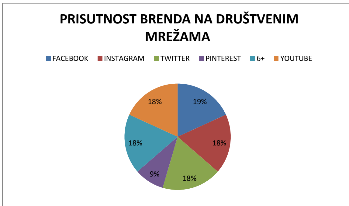
Slika 4: Prisutnost brenda na društvenim mrežama

Vegeta ima svoju službenu web stranicu ali nažalost, ne i na društvenim mrežama. Vegetu brend se može pronaći na mrežama samo u sklopu sa ostalim Podravkinim proizvodima. Na takav način je Vegeta nepravedno zakinuta za popularnost koju zaslužuje kao i za pozitivne komentare, sugestije i upite potrošača. Vegetina službena stranica je modernog dizajna, zanimljivog sadržaja i ponuđenih kvizova za registrirane korisnike. Potrošači mogu poslati e-mail, zvati na besplatni potrošački telefon.