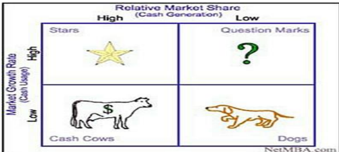
Slika 1: BCG Matrica

Kako vrijeme prolazi, strateške poslovne jedinice mijenjaju svoj položaj na matrici rasta i udjela. Uspješne strateške poslovne jedinice imaju životni ciklus. Počinju kao upitnici, postaju zvijezde, potom krave muzare i naposljetku psi i zato bi tvrtke trebale preispitivati ne samo trenutačne položaje svojih strateških poslovnih jedinica na matrici rasta i udjela nego i svoje promjenjive položaje. 5