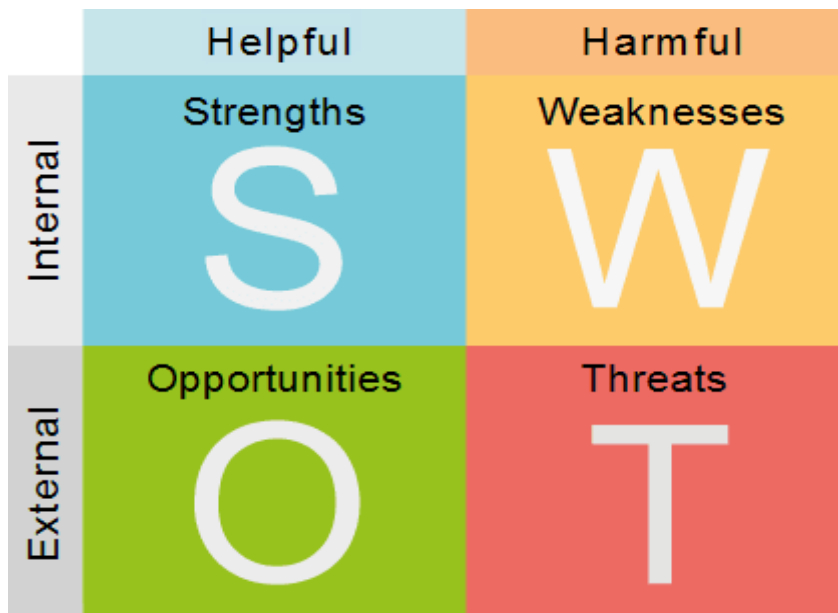
Slika 2: SWOT analiza