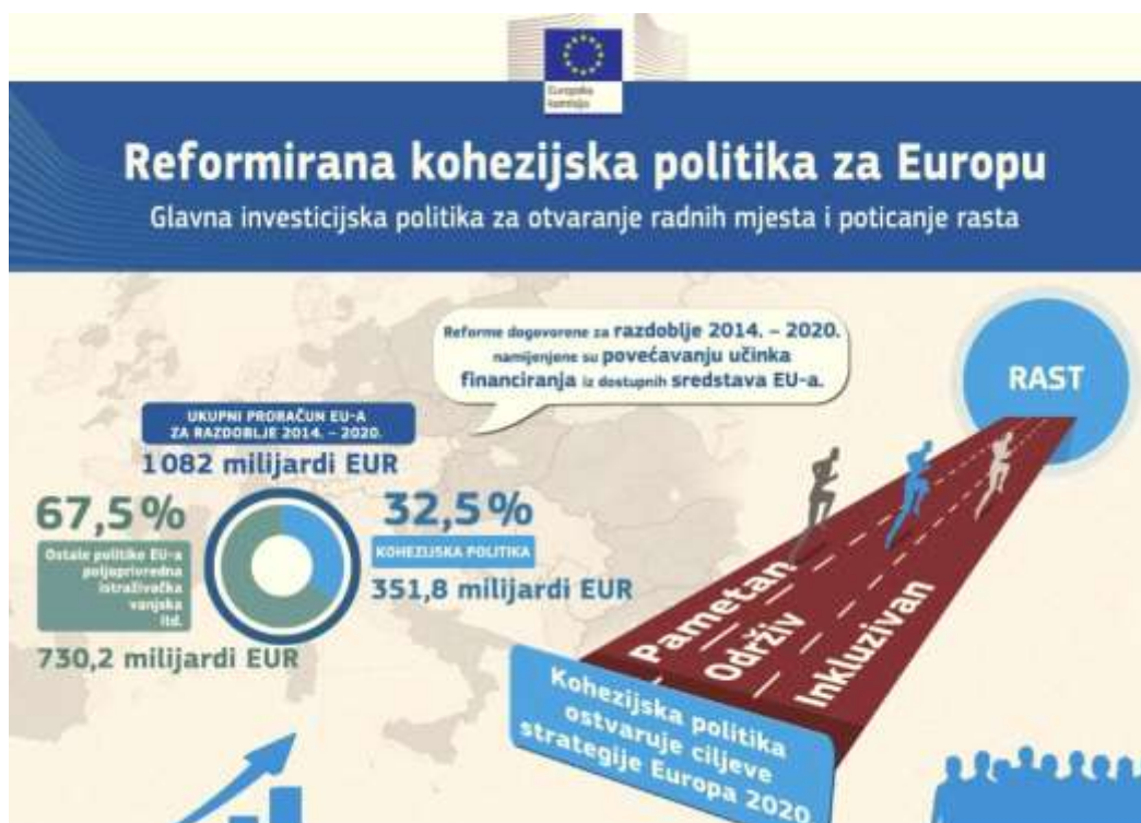
Grafički prikaz 2: Reformirana kohezijska politika za Europu

Iz ukupnog proračuna EU-a za razdoblje 2014. – 2020. za provođenje kohezijske politike izdvojeno je 351,8 milijardi EUR, a od toga Republika Hrvatska ima na raspolaganju 8,397 milijardi EUR za provođenje ciljeva kohezijske politike.