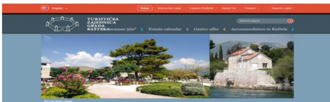
Slika 2: Prikaz službene stranice Turističke zajednice Grada Kaštela u svibnju 2016.

Očito je da su učinjene značajne promjene na stranici, ali može se reći da je više uloženo u poboljšanje u estetskom smislu, nego u smislu upotrebljivosti jer na tom području ima još prostora za napredak. Unatoč tome, upotrebljivost službene web stranice Turističke zajednice Grada Kaštela je sada na prihvatljivoj razini.