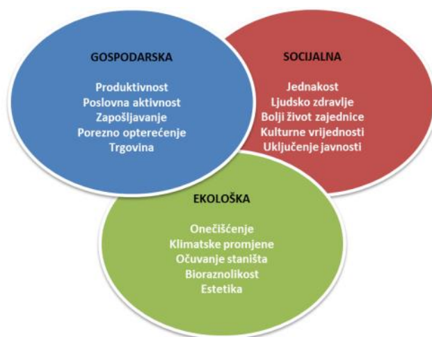
Slika 2 : Ciljevi održivosti

Ukratko, navedene intervencije možemo svrstati u tri skupine, a to su gospodarska, socijalna te ekonomska skupina 13 . Jednaka važnost svake pojedine skupine sa svojim dijelovima prikazana je na slici 2.