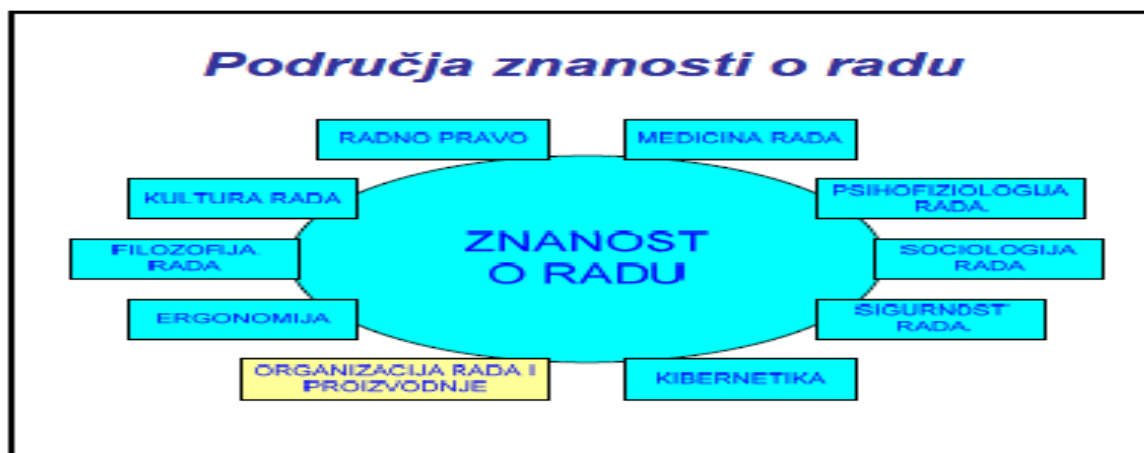
Slika 1. Prikaz područja znanosti o radu

Slika 1. pokazuje da je rad vrlo složena pojava koja ovisi o mnogo čimbenika. Iz tih razloga se razvila široka oblast znanstvenih istraživanja koju nazivamo znanost o radu. Organizacija rada je znanstveno područje u kojem se paralelno rješavaju tehnički, gospodarski, psiho-sociološki i informatički problemi. U radu se koriste i primjenjuju rezultati multidisciplinarnih istraživanja svih onih područja koja proučavaju čovjeka i njegov rad.