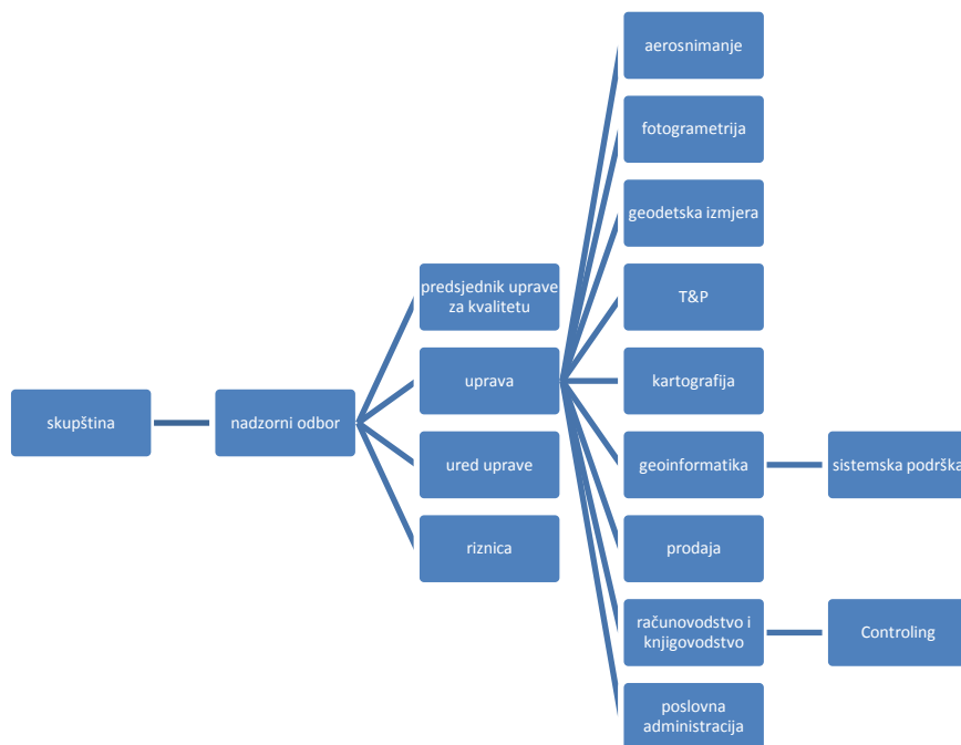
Slika 3 Nova organizacijska struktura rukovodećeg tima

Društvo je od postojećih mjera restrukturiranja provelo određene kadrovske promjene kojima se želi pospešiti efikasnost u radu.