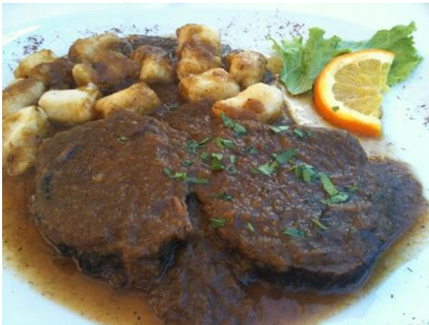
Slika 1. Pašticama

janjetine kuhane s povrćem, pripremljene ispod peke ili na ražnju ili bilo kojeg mesa na roštilju, koje zahvaljujući posebnoj dalmatinskoj marinadi od ružmarina i maslinovog ulja poprima specifičan okus. Od slastica su najpoznatije fritule, paprenjaci, rafiole, bobići i malanduti. Jedan od najpoznatijih otočkih specijaliteta je Viška, odnosno Komiška pogača sa slanim srdelama i lukom, oko koje s Višani i Komižani već stoljećima spore, a čija je jedina razlika to što jedni stavljaju rajčice, a drugi ne. Najcjenjeniji specijalitet neretvanske i cetinske kuhinje su brodet od jegulja i žaba te buzara od riječnih rakova. U Cetinskoj se krajini za vrijeme blagdana spremaju arambašiči, vrste sarme u koje je začinjeno meso umotano u listove kiselog kupusa. Dalmacija je također zemlja vrhunskog vina. Najpoznatija od njih su na poluotoku Pelješcu i otoku Hvaru, iako i Korčula, Lastovo, i Primošten mogu ponuditi jako kvalitetno vino posebnog okusa. Najpoznatije bijele sorte Dalmacije su pošip, debit i manaština. Uz crveno meso i plavu ribu najčešće se piju babiće, plavac, dingač i postup.