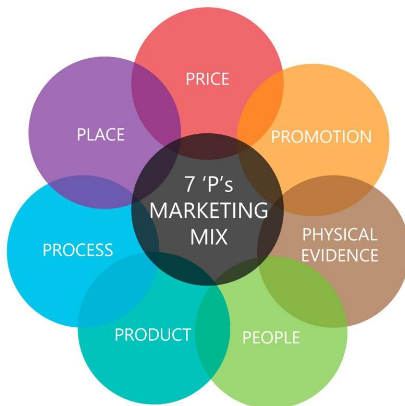
Slika 1: Elementi marketinškog spleta (7P)

U ovom slučaju govorimo o tradicionalnom marketiškom spletu koji uključuju četiri glavne varijable u u klasifikaciju. U turizmu kod marketinškog spleta u razmatranja se uzimaju još tri varijable: ljudi (people), proces pružanja usluga (process) i fizičko okruženje (physical environment/evidence).