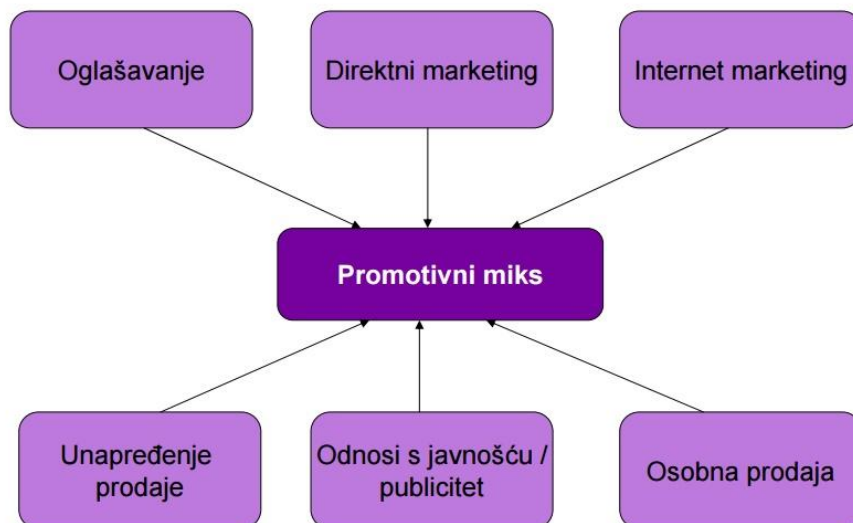
Slika 2. Elementi promotivnog miksa