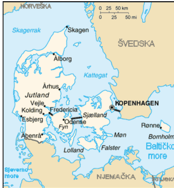
Slika 3. Karta Danske