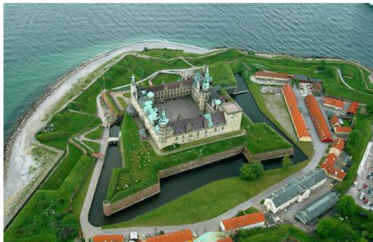
Slika 6. Dvorac Kronborg

Glavni proizvod dvorca Kronborg su turističke ture kroz dvorac kao kulturnu ustanovu te izvođenje Shakespeareove predstave „Hamlet“, što je prvenstveni razlog zbog kojeg je ovaj dvorac stekao svjetsku slavu. No, za one koji odluče ne izdvojiti dodatan novac za prisustvovanje turističkoj turi, moguće je samo izdvojiti novčanu naknadu za ulazak u dvorac te samostalno uživati u svim blagodatima koje dvorac pruža. Posjetiteljima se pruža detaljan uvid u povijest dvorca, njegov nastanak te su upoznati sa životom kralja Fridrika 2. koji je zaslužan za današnji izgled dvorca i nastanak njegovog imena. Osim toga, imati će priliku vidjeti izvođenje predstave „Hamlet“. U bilo kojem dijelu dvorca da se gost prisustvovat će izvođenju pojedinog dramskog čina „Hamleta“. Glumci izvode predstavu na engleskom jeziku, no znanje engleskog jezika nije nužno za razumijevanje drame i proživljavanje iskustva koja ona pruža.