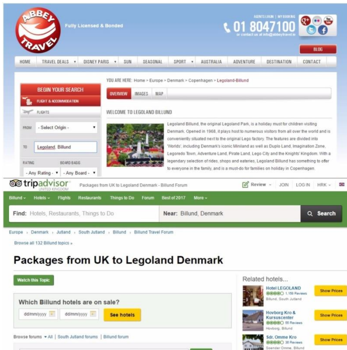
Slika 5. Rezervacijske usluge putem posrednika (TripAdvisor i Abbey Travel)