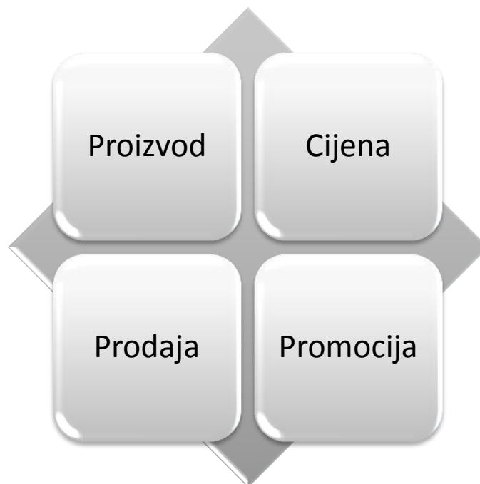
Slika 2. Prikaz 4P