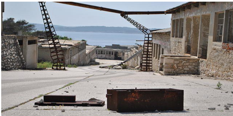
Slika 5: Zapuštene zgrade na Golom otoku

brodovima-cisternama." 25 Najvažnije zgrade označene su objašnjenjima na četiri svjetska jezika kako bi sadržaj približili turistima. Na Golom otoku danas postoji čitav niz devastiranih, ali postojanih objekata kaznionice te lučko pristanište koje je u mogućnosti izvršiti prihvat i većih brodova. Kaznionica čije se zapuštene zgrade i prateći objekti prema podacima DUUDI-a prostiru na 4.500 četvornih metara već godinama propada.