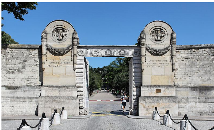
Slika 12: Glavni ulaz na groblje Père Lachaise u Parizu