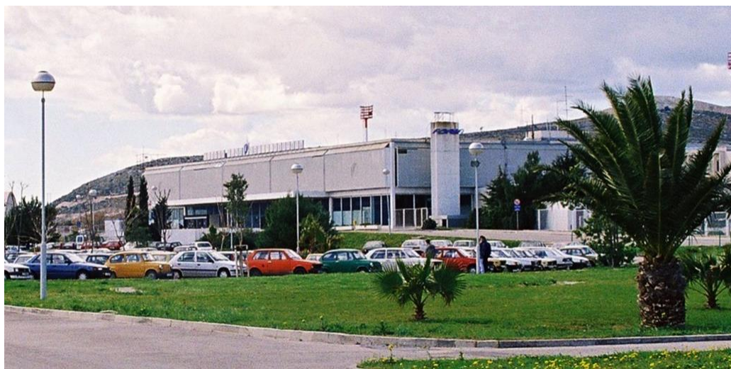
Slika 2.: Novi putnički terminal izgrađen 1979.

Planirani broj od 150.000 putnika godišnje premašen je već 1968. godine. Porast zanimanja turista, prodaje turističkih aranžmana, a time i prometa u Zračnoj luci Split nastavlja se i slijedećih godina da bi kulminirao 1987. godine, s ukupno 1.151.580 putnika i 7.873 zrakoplova.